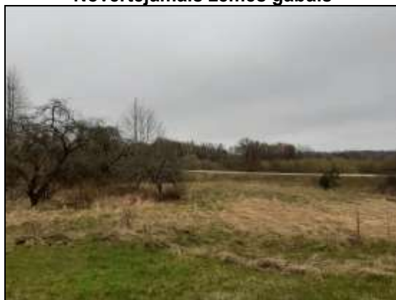
Novērtējamais zemes gabals

Novērtējamais īpašums: "Apses", Aglonas pagastā, Aglonas novadā.