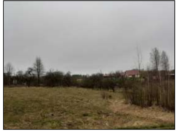
Novērtējamais zemes gabals