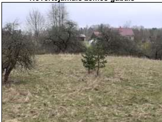
Novērtējamais zemes gabals