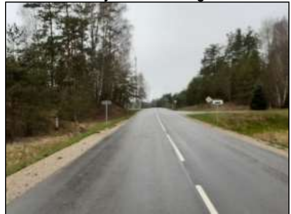
Valsts ceļu P60 Dagda - Aglona

Novērtējamais īpašums: "Apses", Aglonas pagastā, Aglonas novadā.