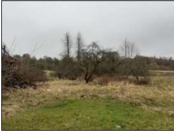
Novērtējamais zemes gabals