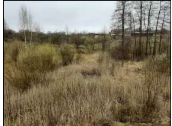
Novērtējamais zemes gabals