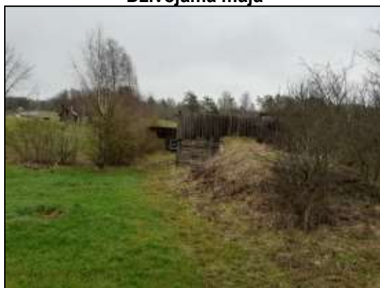
Novērtējamais zemes gabals