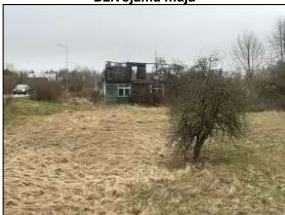
Novērtējamais zemes gabals