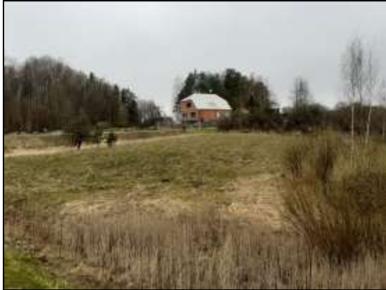
Novērtējamais zemes gabals