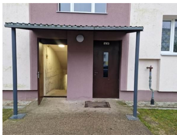
Ieeja kāpņu telpā