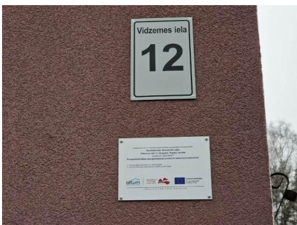
Ēkas adreses plāksnīte