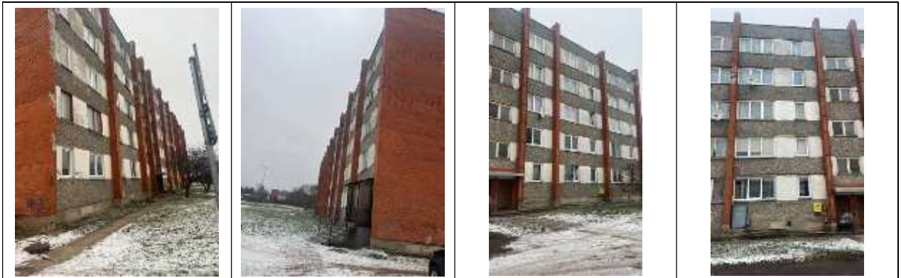
Daudzdzīvokļu dzīvojamā ēka