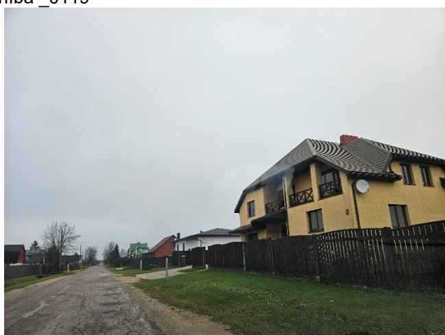
Uz zemes vienības _0119 esošā apbūve