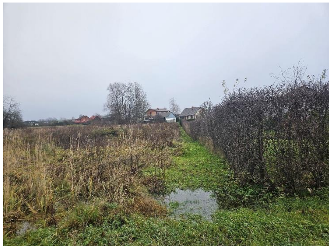
Zemes vienība _0119