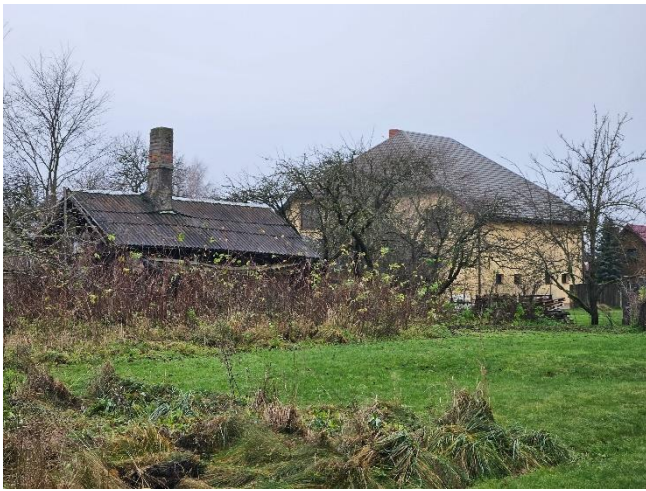
Zemes vienība _0119