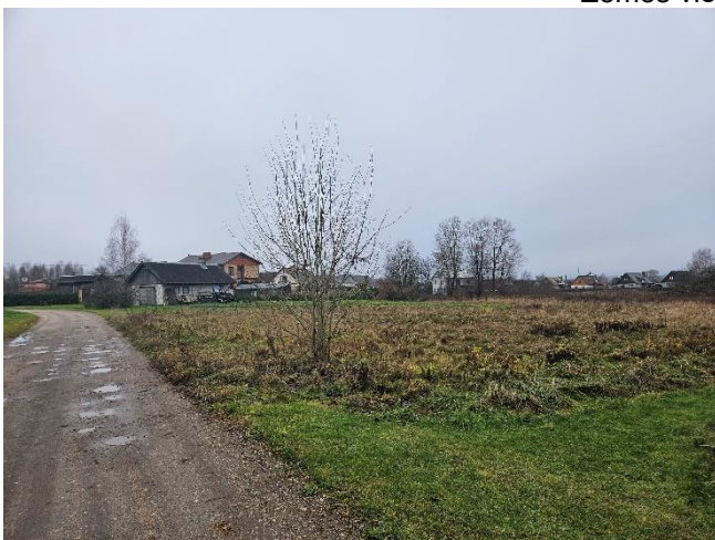
Zemes vienība _120 (skats no no Miglas ielas)