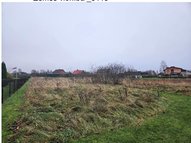
Zemes vienība _0120