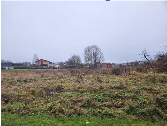
Zemes vienība _0120