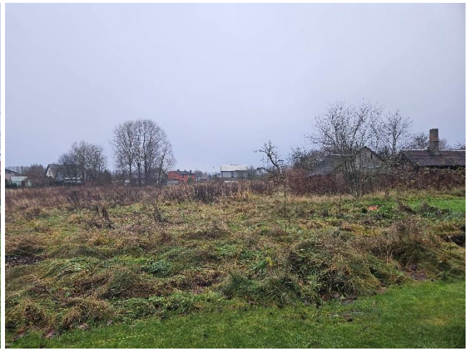
Zemes vienība _0119