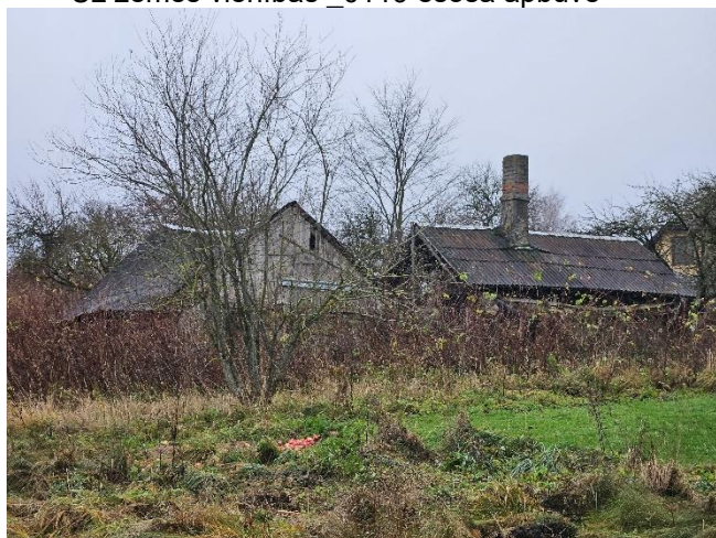
Uz zemes vienība _0119 esošā apbūve