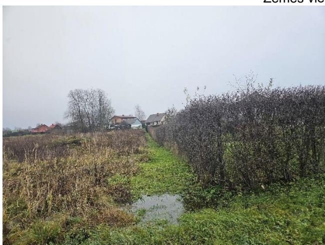
Zemes vienība _0119