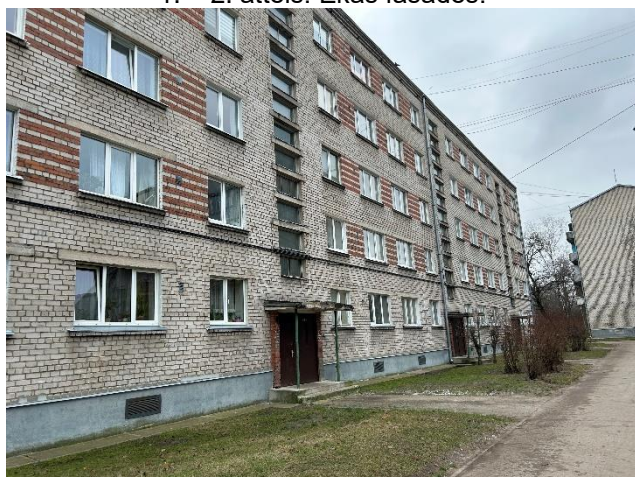
1. – 2. attēls. Ēkas fasādes.