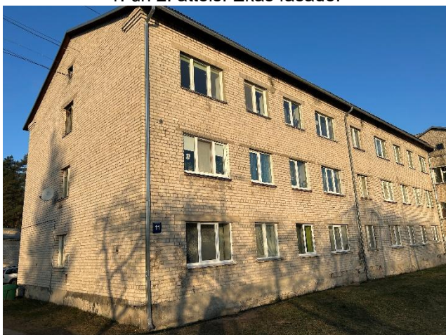
1. un 2. attēls. Ēkas fasāde.