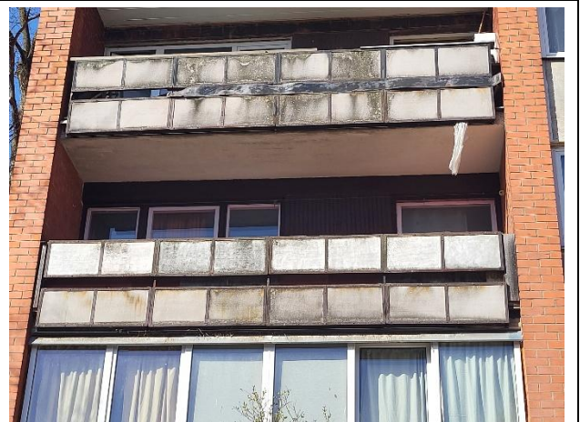
DZĪVOKĻA LODŽIJA, LOGI