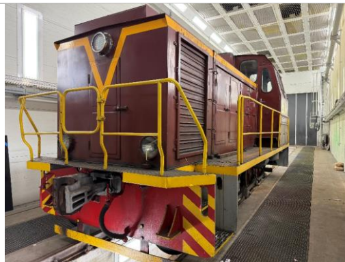
Lokomotīve TGM23V48, borta Nr.1003, Rīgā, Kalna ielā 68