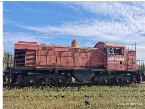
Lokomotīve TGM4, borta Nr.1458, Vecmīlgrāvis.