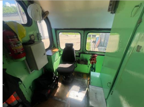
Lokomotīve TGM4A, borta Nr.1945, Lietuva.