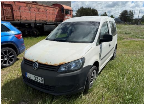
VW Caddy v/n LI3239