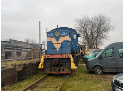
Lokomotīve TGM4, borta Nr.2054, Lietuva. Uzņēmuma pārstāvja iesniegtā foto fiksācija.