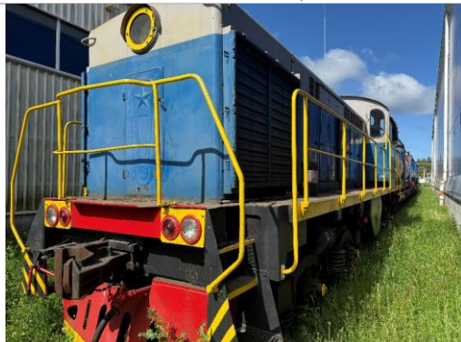
Lokomotīve TGM4, borta Nr.1055, Boldorāja