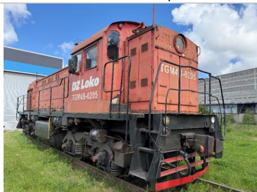
Lokomotīve TGM4B, borta Nr.0205, Rīgā, Biksēres 6