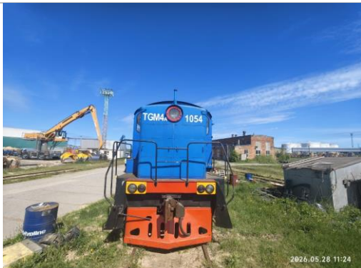
Lokomotīve TGM4A, borta Nr.1054, Vecmīlgrāvis.