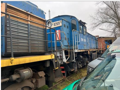
Lokomotīve TGM4B, borta Nr.0269, Lietuva.