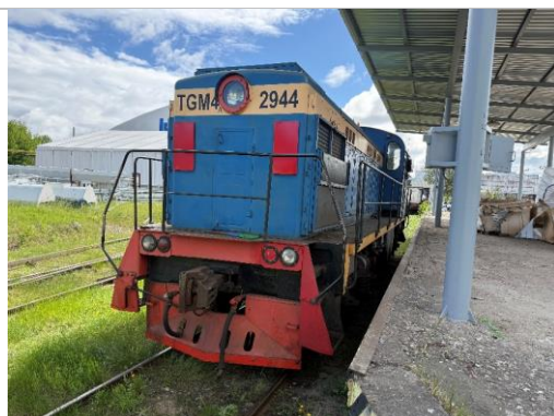
Lokomotīve TGM4B, borta Nr.2944, Boldorāja