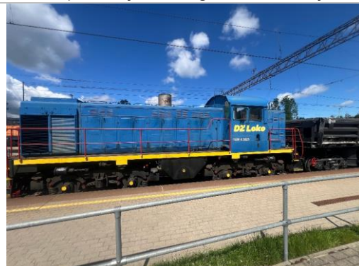
Lokomotīve TGM4, borta Nr.3025, Jelgava.