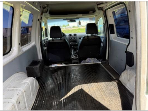
Skats kravas nodalījumā