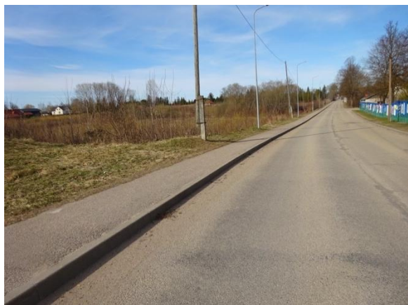
Piebraukšana zemesgabalam no Rēznas ielas