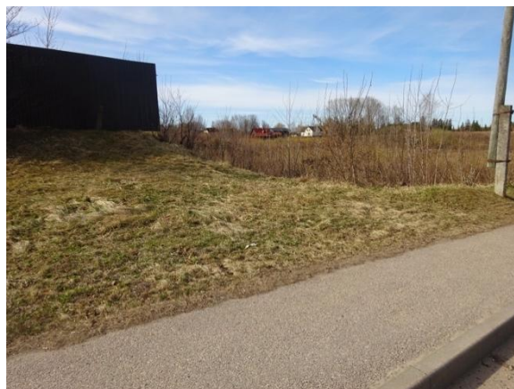
Skats uz zemesgabalu