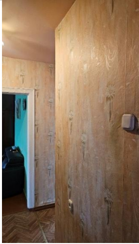
Gaitenis (telpa Nr.7)