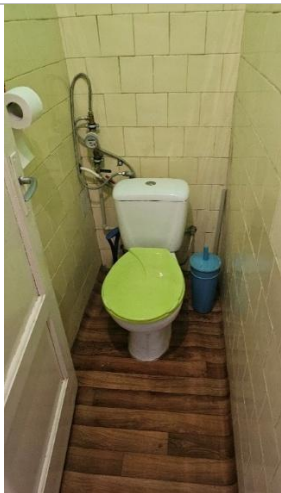
Tualete (telpa Nr.6)