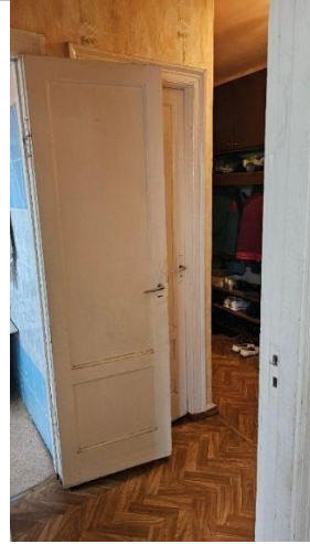
Gaitenis (telpa Nr.7)