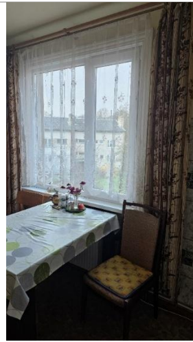
Virtuve (telpa Nr.3)