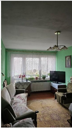
Istaba (telpa Nr.2)