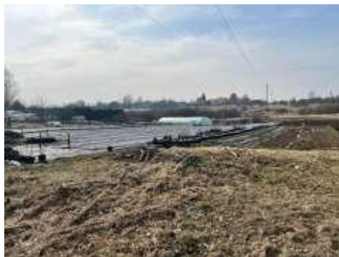
Skats uz zemes vienību ar kadastra apzīmējumu 8401 002 0246