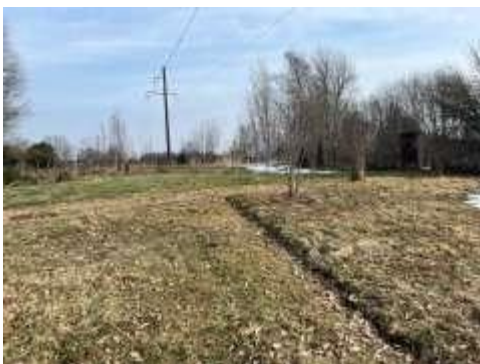
Skats uz zemes vienību ar kadastra apzīmējumu 8401 002 0246