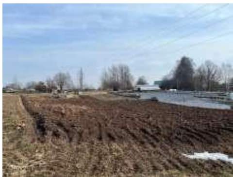
Skats uz zemes vienību ar kadastra apzīmējumu 8401 002 0246