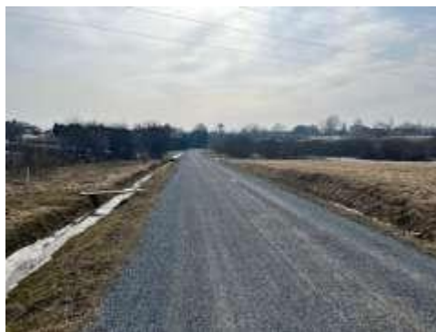
Skats uz Rietumu ielu