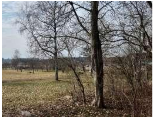
Skats uz zemes vienību ar kadastra apzīmējumu 8494 006 0237