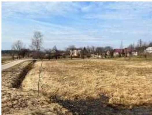
Skats uz zemes vienību ar kadastra apzīmējumu 8494 006 0237