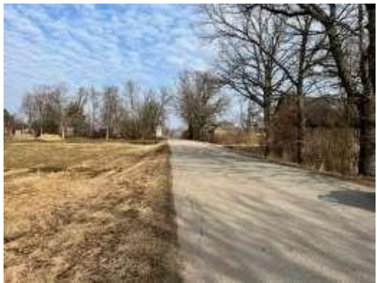
Autoceļš V1164 Kursīši - Zaņa