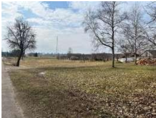
Skats uz zemes vienību ar kadastra apzīmējumu 8494 006 0237