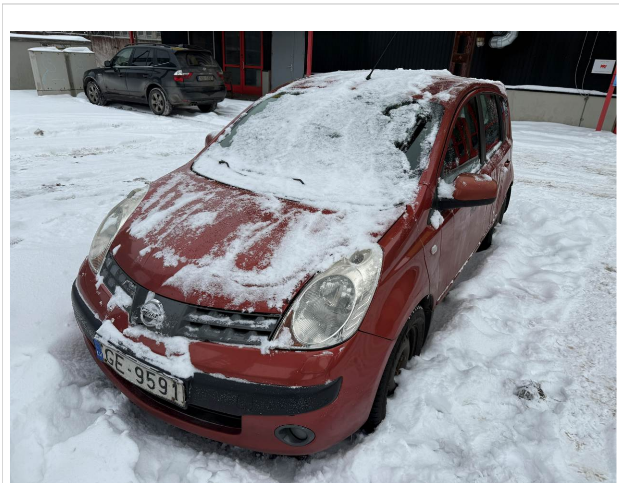
Nissan Note, Reģ. Nr. GE9591