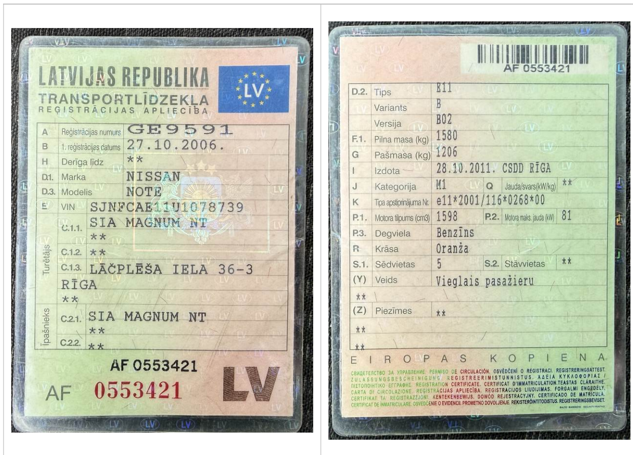
Reģ. Apl. Nr. AF 0553421