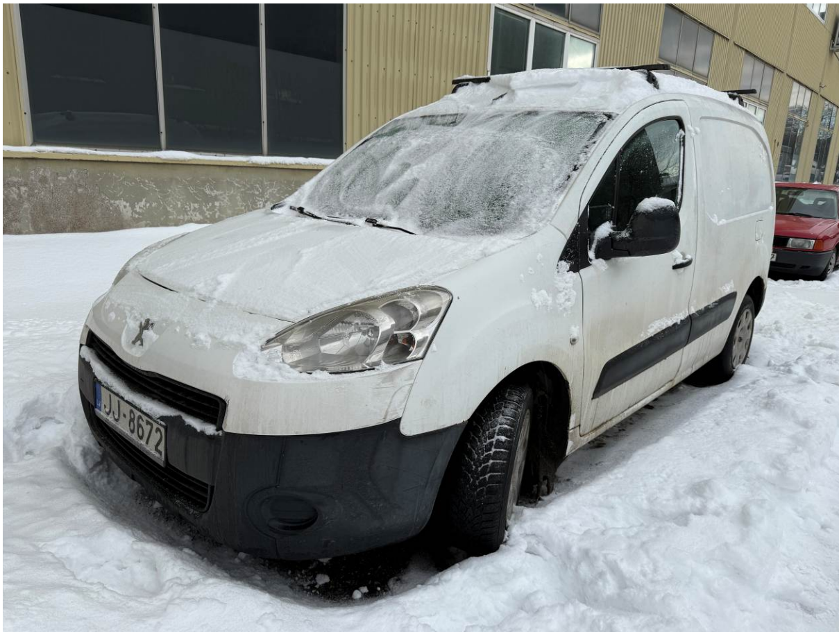
Peugeot Partner, Reģ. Nr. JJ8672