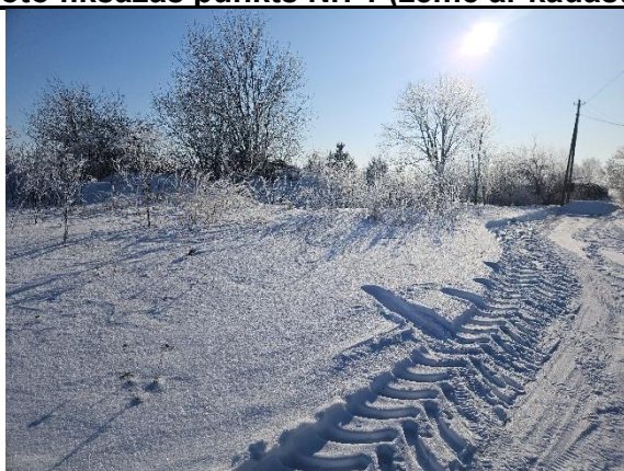
Foto fiksācijas punkts Nr. 1 (zeme ar kadastra apz. 54900060128)