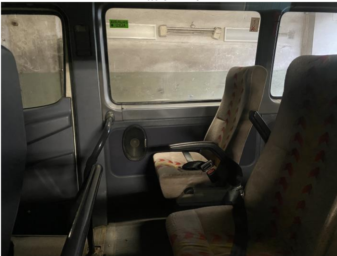
Attēls Nr. 21