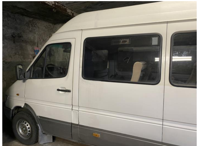
Attēls Nr. 18