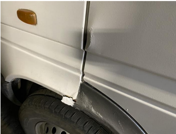
Attēls Nr. 9