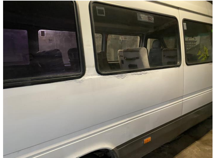
Attēls Nr. 8