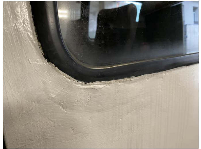
Attēls Nr. 10