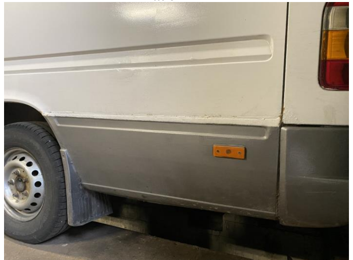
Attēls Nr. 16