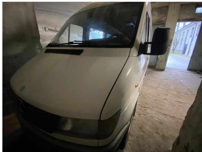
Attēls Nr. 2