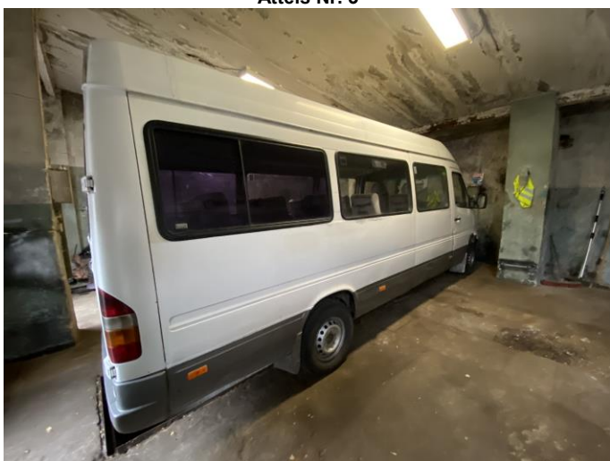
Attēls Nr. 5