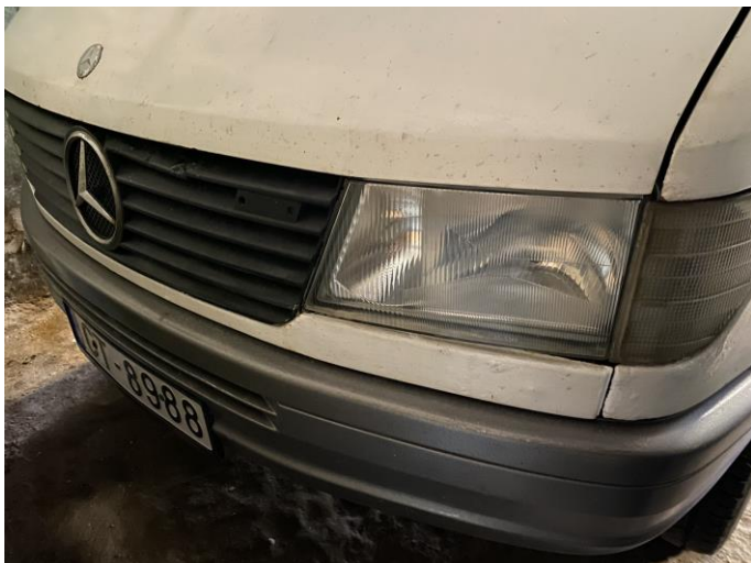
Attēls Nr. 1