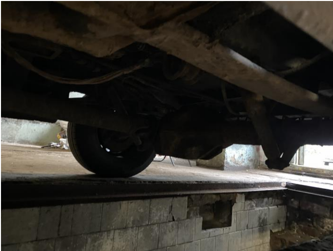
Attēls Nr. 19