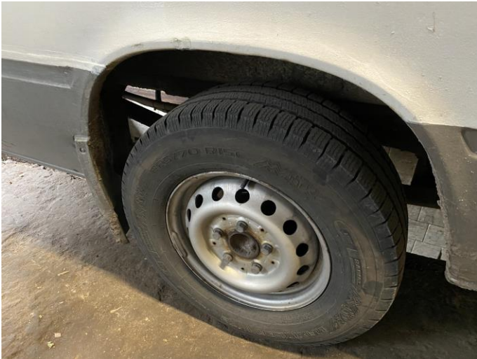
Attēls Nr. 13