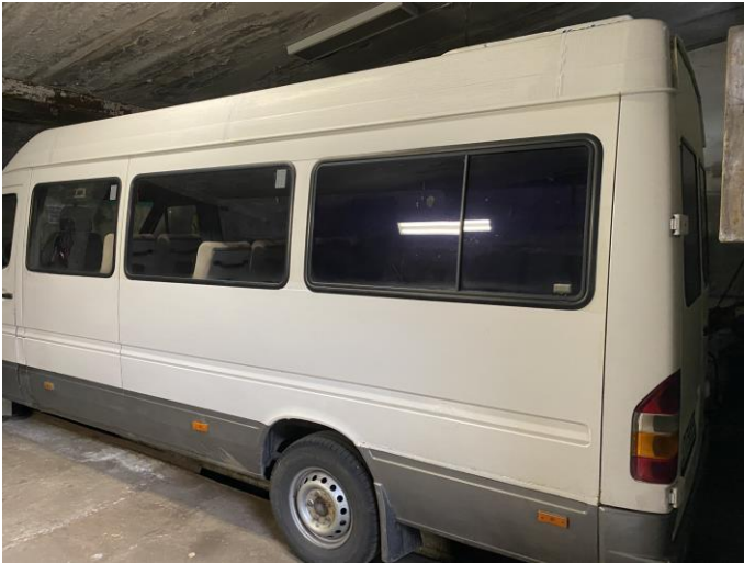
Attēls Nr. 7