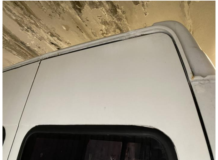
Attēls Nr. 14