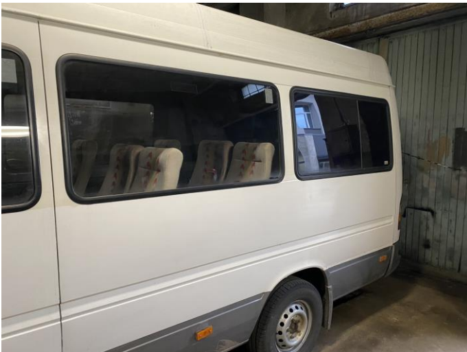
Attēls Nr. 17