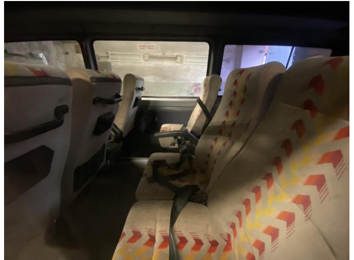
Attēls Nr. 20