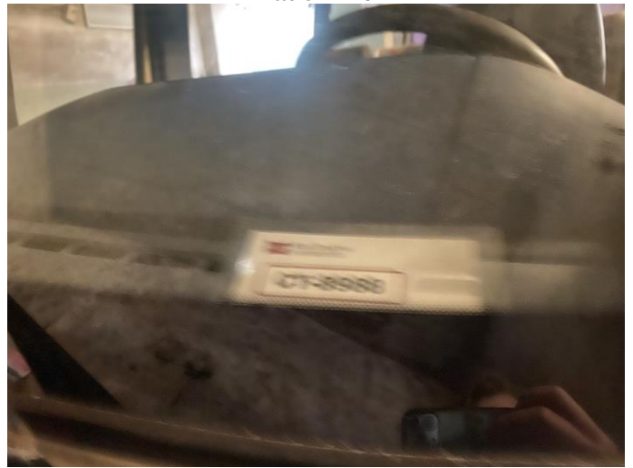
Attēls Nr. 22