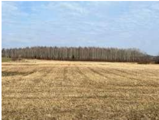
Skats uz zemes vienību ar kadastra apzīmējumu 8470 004 0056