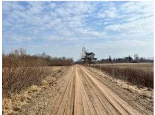
Pašvaldības piebraucamais ceļš