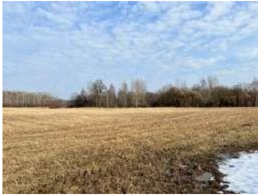
Skats uz zemes vienību ar kadastra apzīmējumu 8470 004 0056