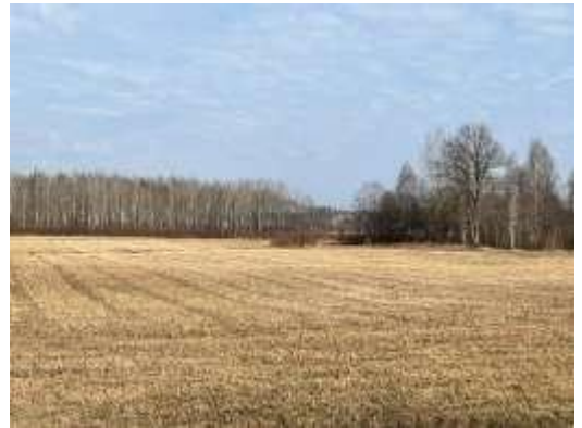
Skats uz zemes vienību ar kadastra apzīmējumu 8470 004 0056