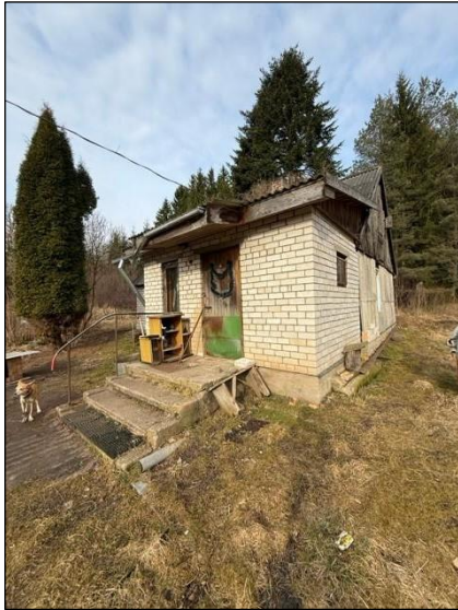
Dzīvojamā māja kad.apz. 84800030104004