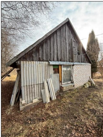
Dzīvojamā māja kad.apz. 84800030104004