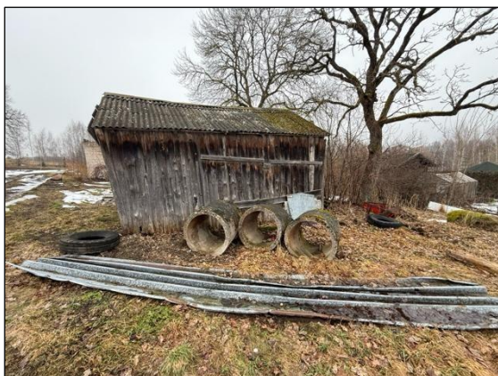
Ēkas ar kadastra apzīmējumiem (84700020081001, 84700020081003)