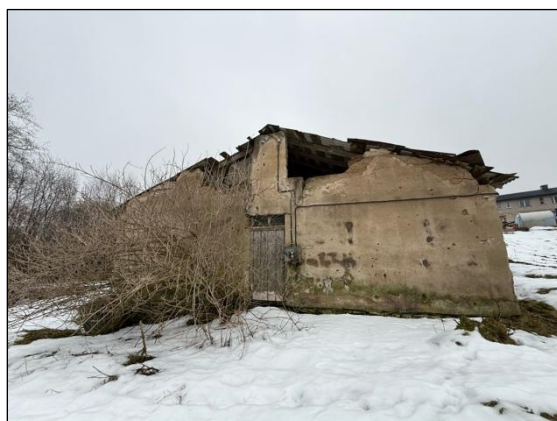
Ēka ar kadastra apzīmējumu (84700020081002)