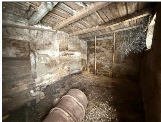
Ēkas (84700020081002) iekštelpa