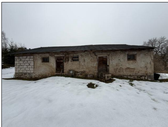
Ēka ar kadastra apzīmējumu (84700020081002)