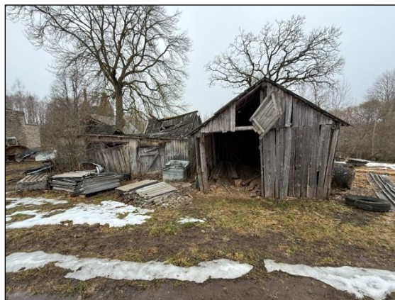
Ēkas ar kadastra apzīmējumiem (84700020081001, 84700020081003)