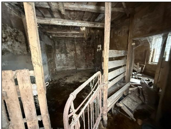
Ēkas (84700020081002) iekštelpa