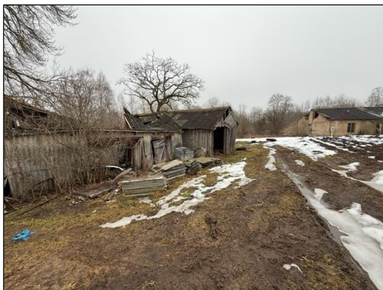
Ēkas ar kadastra apzīmējumiem (84700020081001, 84700020081003)