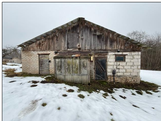
Ēka ar kadastra apzīmējumu (84700020081002)