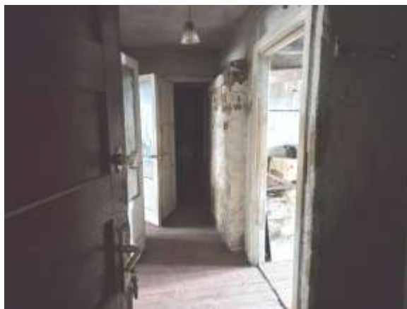
Skats uz koridoru