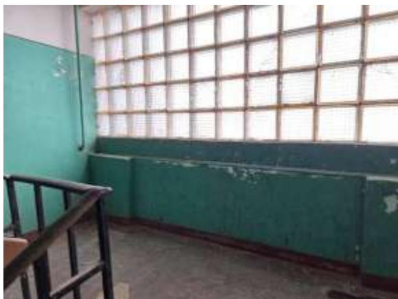
Skats uz kāpņu telpu