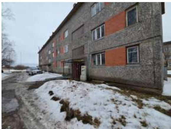
Skats uz dzīvojamo māju