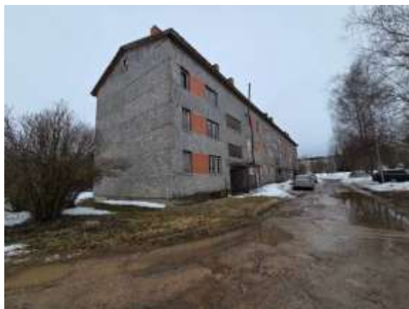
Skats uz dzīvojamo māju