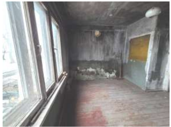
Skats uz virtuvi