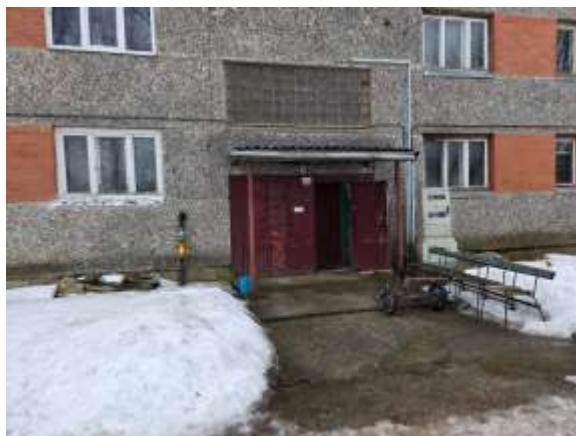
Skats uz kāpņu telpas ārdurvīm