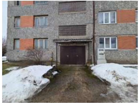
Skats uz kāpņu telpas ārdurvīm