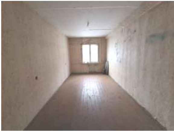
Skats uz istabu