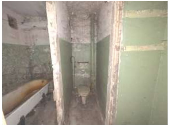
Skats uz vannas istabu, tualeti