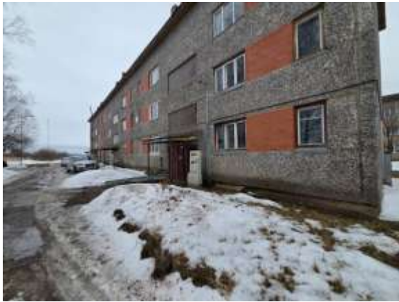
Skats uz dzīvojamo māju