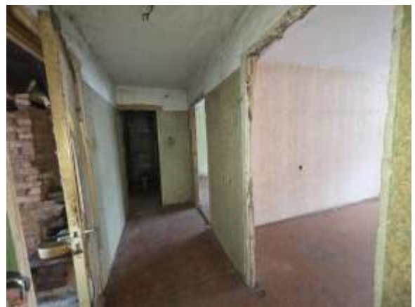
Skats uz koridoru