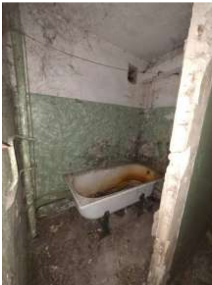
Skats uz vannas istabu