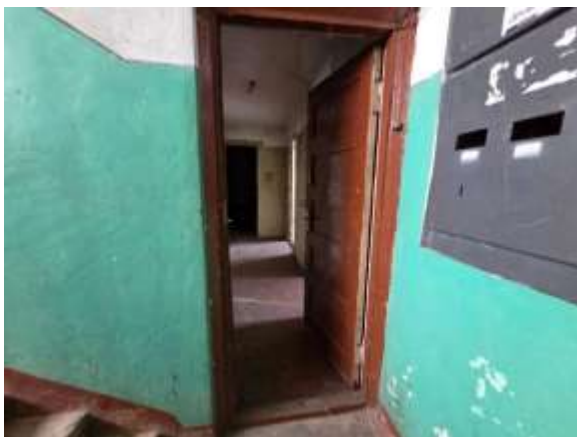
Skats uz dzīvokļa ārdurvīm