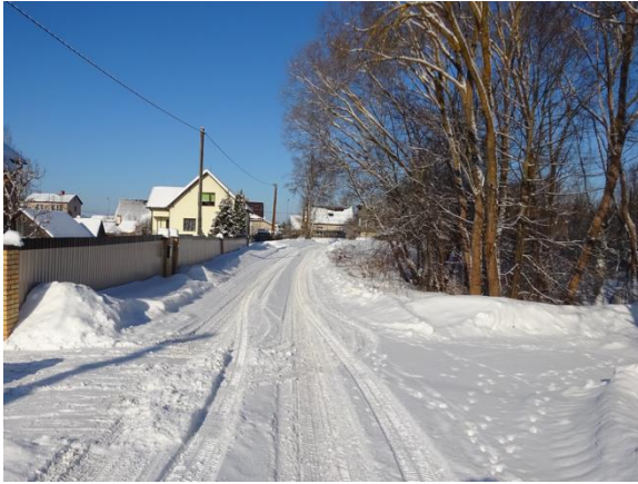
Piebraukšana zemesgabalam no Lauku ielas