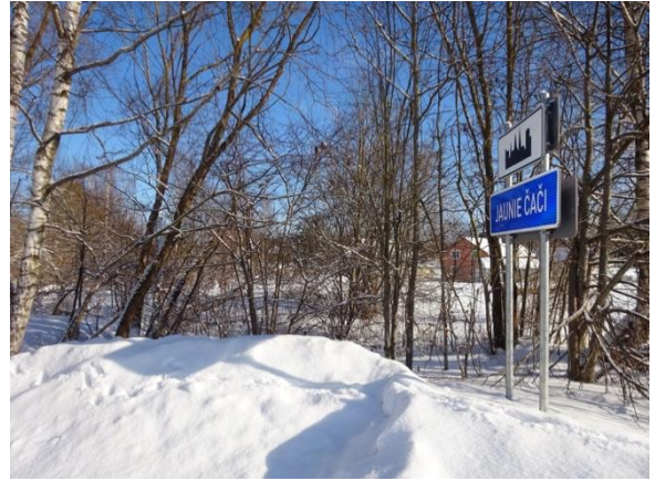
Skats uz zemesgabalu