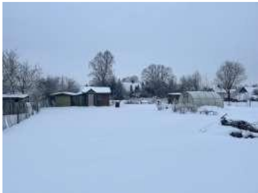
Skats uz zemes vienību ar kadastra apzīmējumu 8401 012 0305