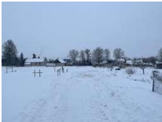
Skats uz piebraucamo ceļu Zvārdes ielā