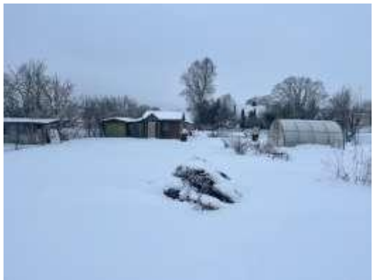
Skats uz zemes vienību ar kadastra apzīmējumu 8401 012 0305