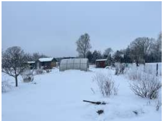
Skats uz zemes vienību ar kadastra apzīmējumu 8401 012 0305