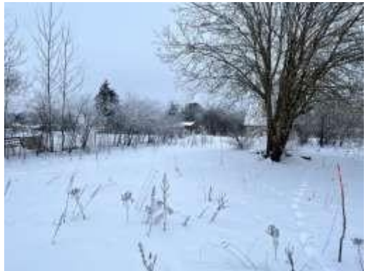
Zemes vienība ar kadastra apzīmējumu 8486 002 0189