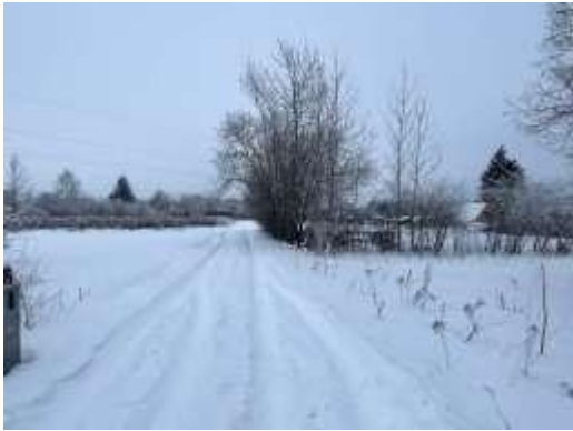
Piebraucamais ceļš D/s teritorijā