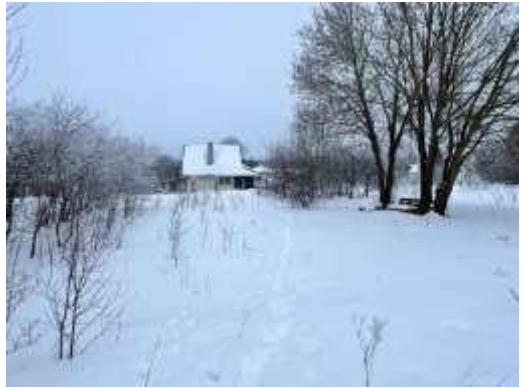
Zemes vienība ar kadastra apzīmējumu 8486 002 0189