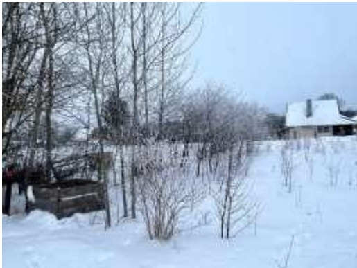
Zemes vienība ar kadastra apzīmējumu 8486 002 0189