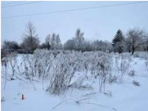
Zemes vienība ar kadastra apzīmējumu 8486 002 0171