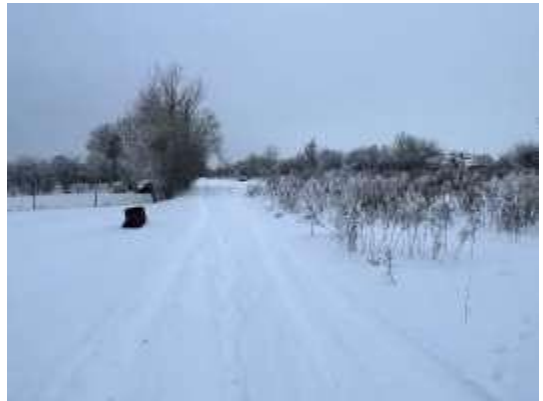
Piebraucamais ceļš D/s teritorijā