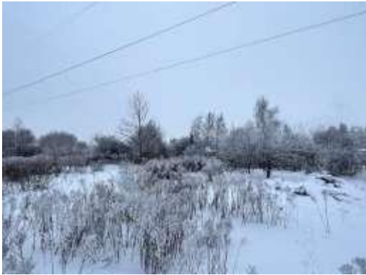
Zemes vienība ar kadastra apzīmējumu 8486 002 0171