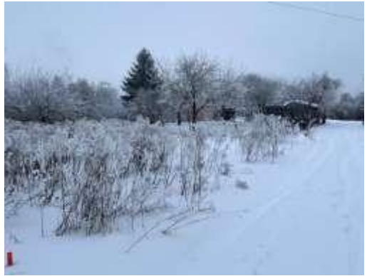
Zemes vienība ar kadastra apzīmējumu 8486 002 0171