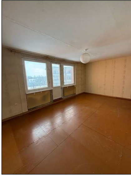
Istaba, telpa nr.1