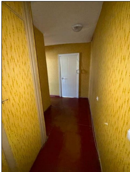
Gaitenis, telpa nr.5