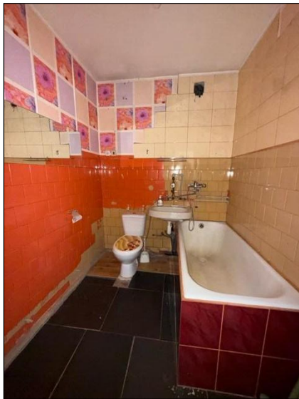
Sanitārais mezgls, telpa nr.3