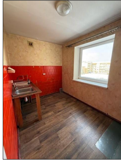
Virtuve, telpa nr.2