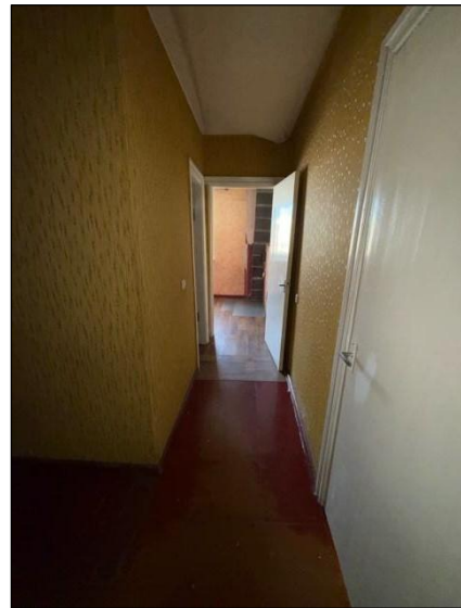
Gaitenis, telpa nr.5