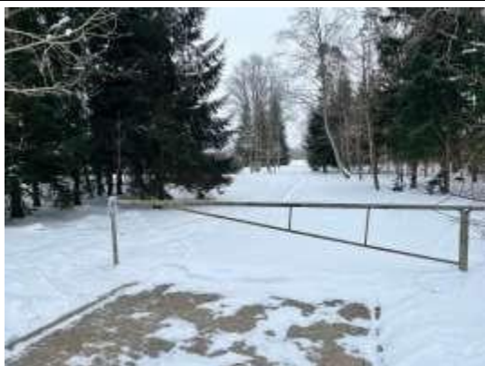
Skats uz piebraucamo ceļu Saules ielu