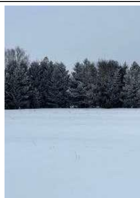
Zemes vienība ar kadastra apzīmējumu 8405 004 0220