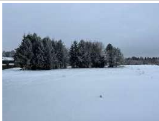
Zemes vienība ar kadastra apzīmējumu 8405 004 0220