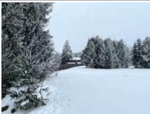
Zemes vienība ar kadastra apzīmējumu 8405 004 0220