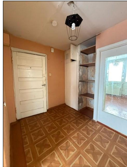
Gaitenis, telpa nr.8