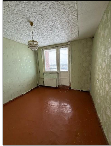
Istaba, telpa nr.1