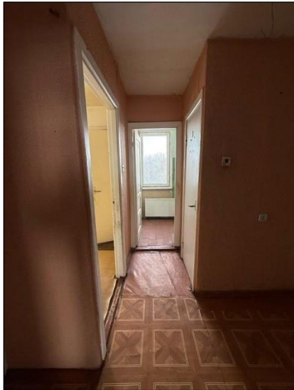
Gaitenis, telpa nr.8