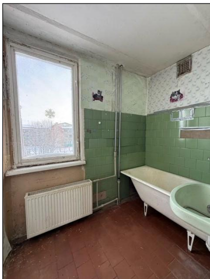
Vannas istaba, telpa nr.5