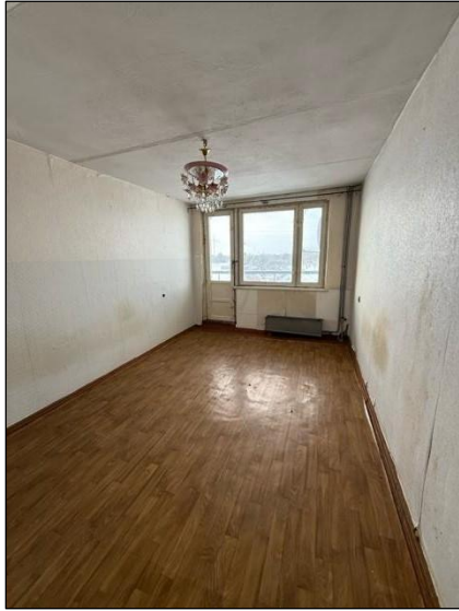
Istaba, telpa nr.2