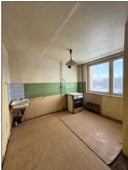
Virtuve, telpa nr.3