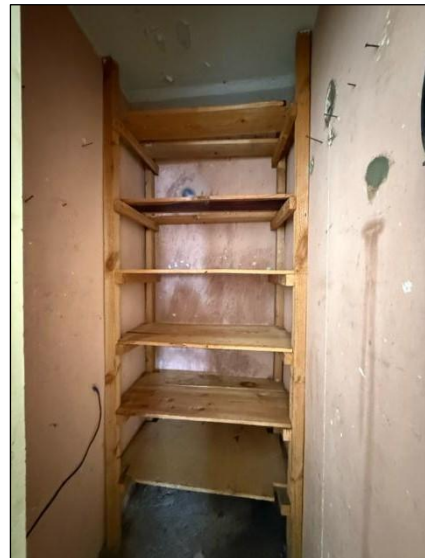
Pieliekamais, telpa nr.4