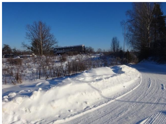
Skats uz zemesgabalu no Ļermontova ielas