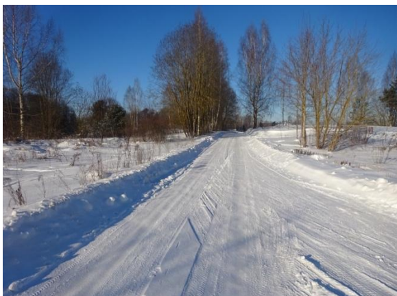
Piebraukšana zemesgabalam no A.Upīša ielas