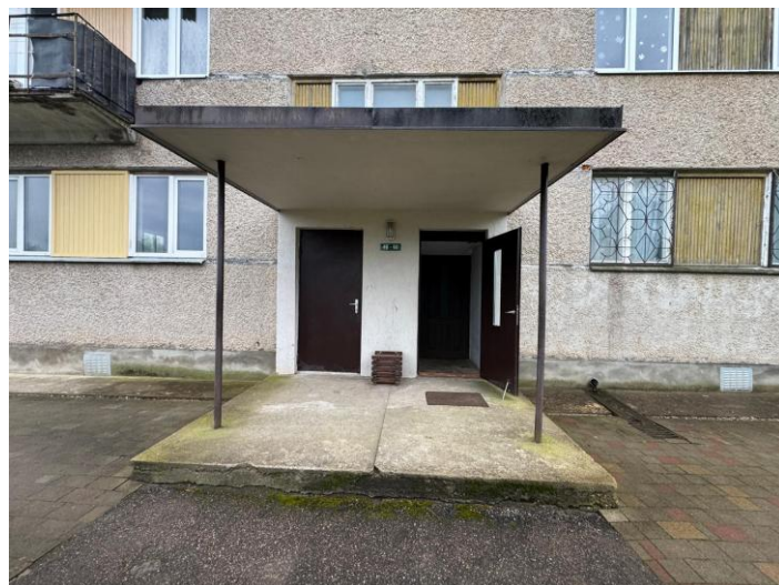
Skats uz ēkas ieejas durvīm