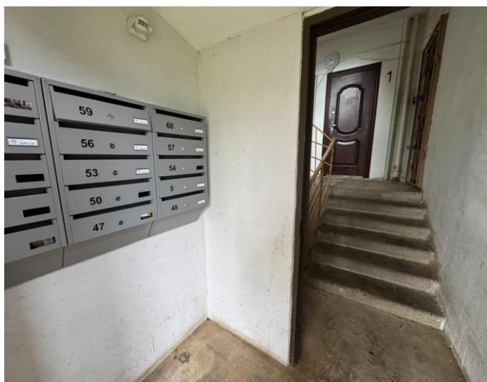
Skats uz kāpņu telpu