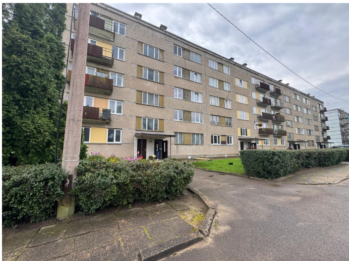
Skats uz dzīvojamo ēku