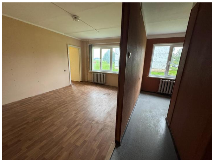
Gaitenis nr. 5