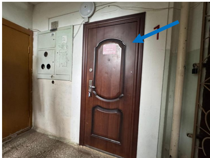
Skats uz ieejas durvīm