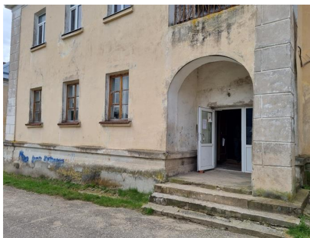
Daudzdzīvokļu mājas ārskati