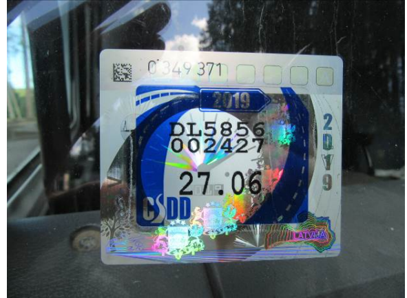
Renault M150, DL5856