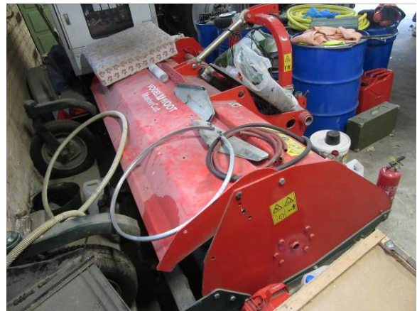
Zāles pļāvējs – smalcinātājs, MASTER CUT TST 230, PL Nr. 19000114