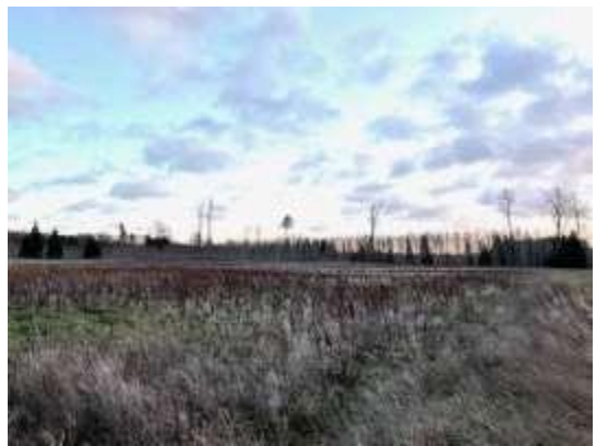
Skats uz zemes vienību ar kadastra apzīmējumu 8480 003 0362