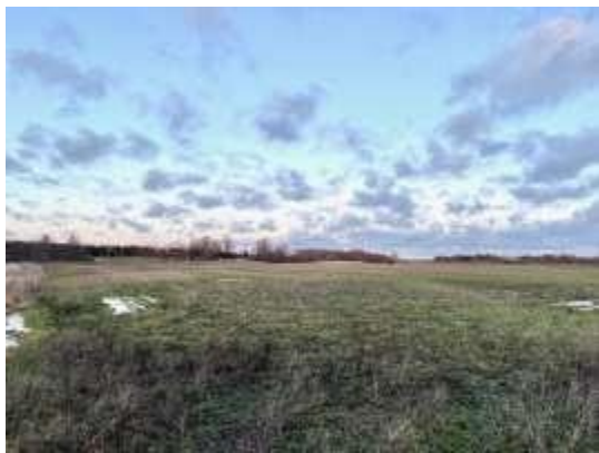
Skats uz zemes vienību ar kadastra apzīmējumu 8480 003 0362