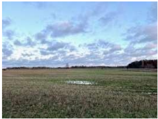
Skats uz zemes vienību ar kadastra apzīmējumu 8480 003 0362