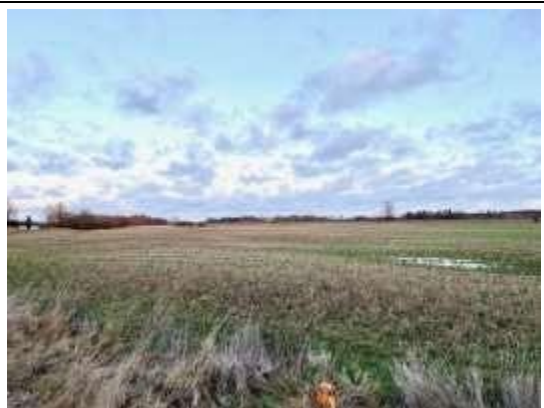
Skats uz zemes vienību ar kadastra apzīmējumu 8480 003 0362