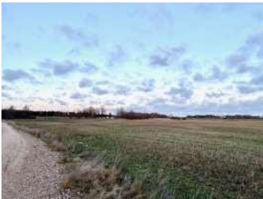
Skats uz zemes vienību ar kadastra apzīmējumu 8480 003 0362