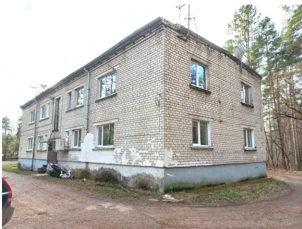
Skats uz dzīvojamo ēku