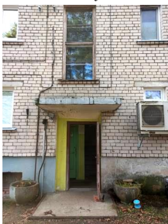
Skats uz kāpņu telpas durvīm