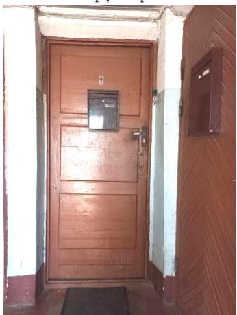
Skats uz dzīvokļa durvīm