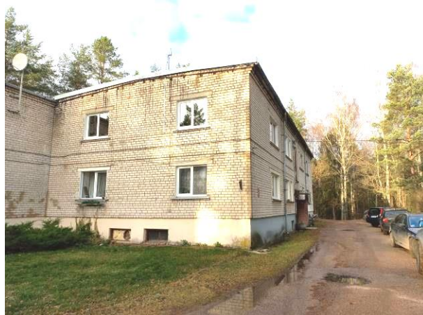
Skats uz dzīvojamo ēku