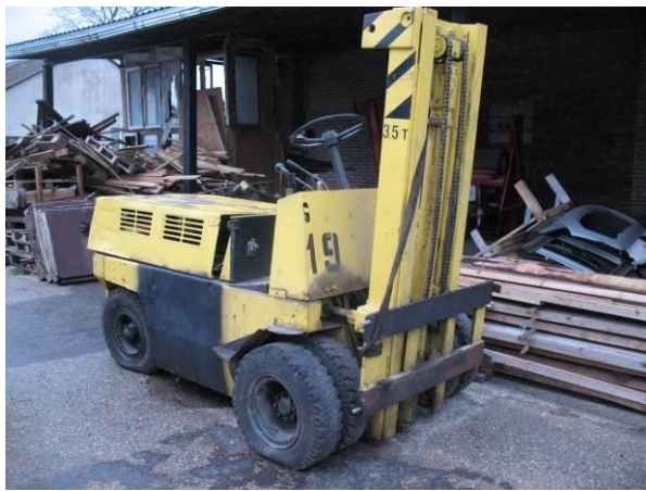
Iekrāvējs Toyota 52-6FG35