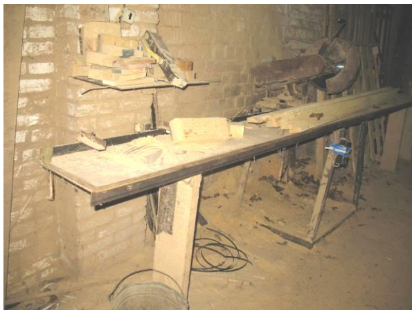
Malkas zāģis - kokmateriālu garinātājs