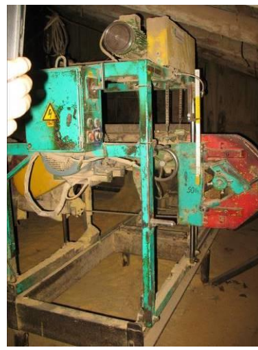
Horizontālais lentzāģis „TEHNIKA AUCE” ZBL-50H