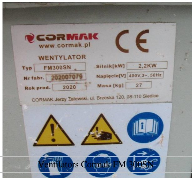
Ventilators Cormak FM 300SN