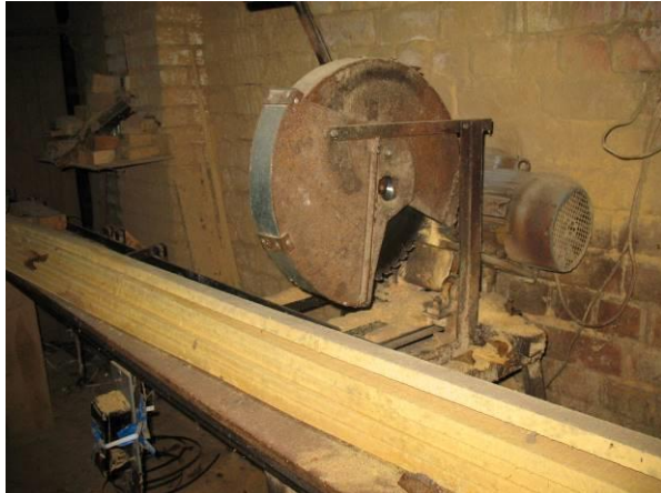
Malkas zāģis - kokmateriālu garinātājs