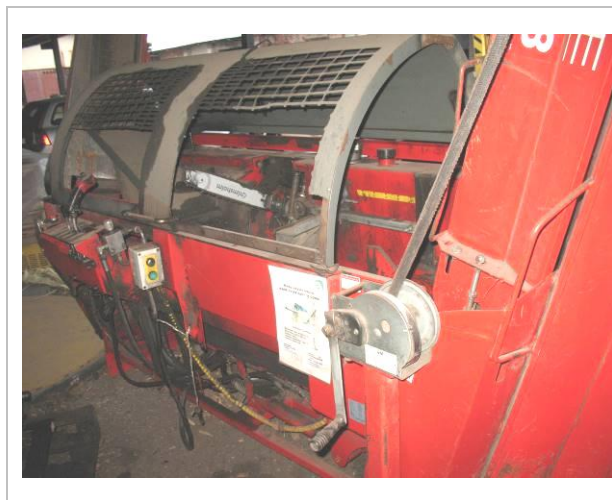
Malkas zāģis - skaldītājs HAKI PILKE EASY 38