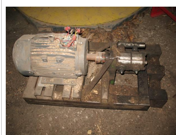
Hidrostanacija (paredzēta Haki malkas skaldītājam)