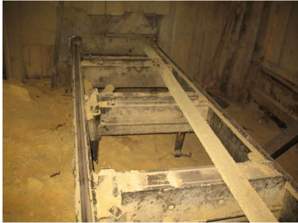
Horizontālais lentzāģis „TEHNIKA AUCE” ZBL-50H