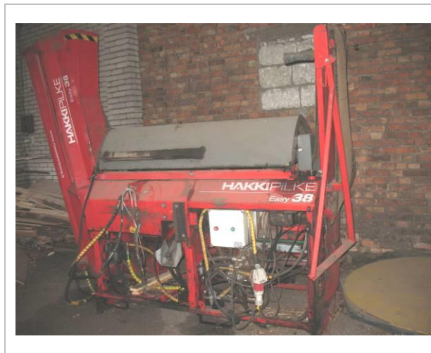
Malkas zāģis - skaldītājs HAKI PILKE EASY 38