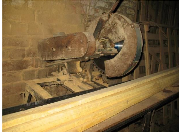
Malkas zāģis - kokmateriālu garinātājs