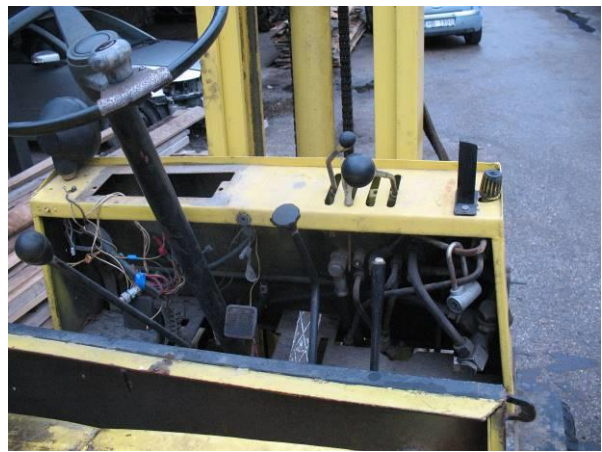
Iekrāvējs Toyota 52-6FG35