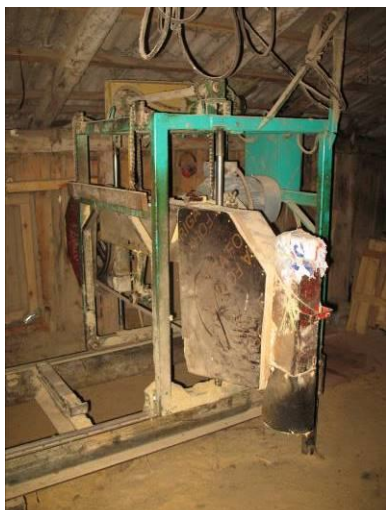
Horizontālais lentzāģis „TEHNIKA AUCE” ZBL-50H