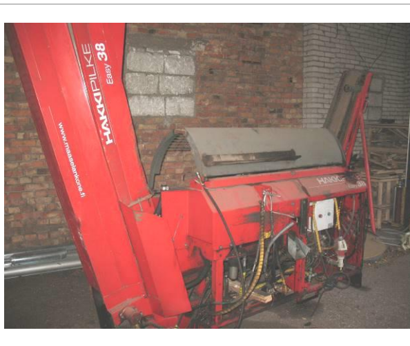
Malkas zāģis - skaldītājs HAKI PILKE EASY 38