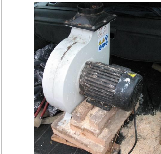
Ventilators Cormak FM 300SN