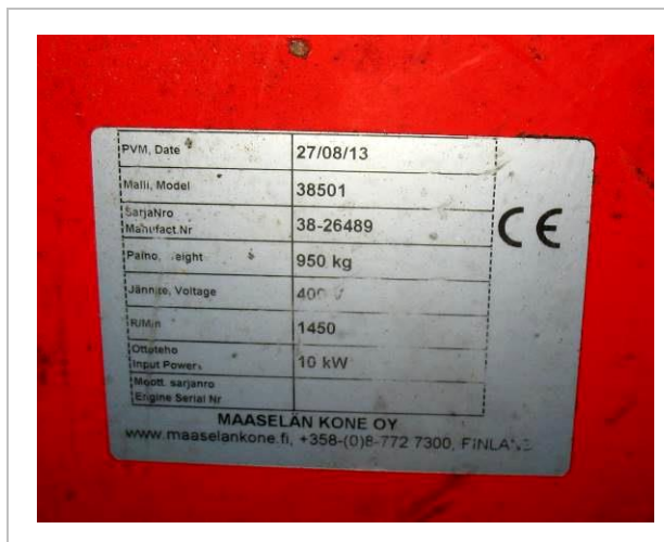
Malkas zāģis - skaldītājs HAKI PILKE EASY 38