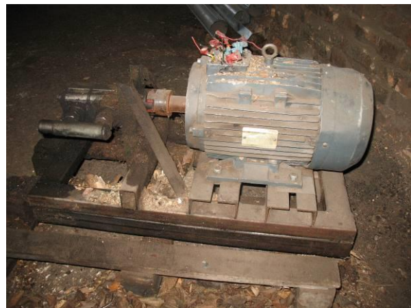
Hidrostanacija (paredzēta Haki malkas skaldītājam)