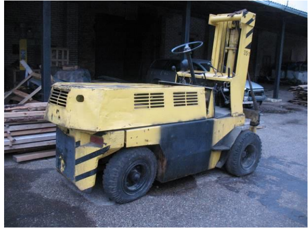
Iekrāvējs Toyota 52-6FG35