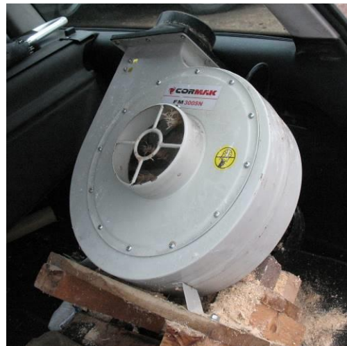
Ventilators Cormak FM 300SN