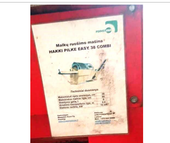
Malkas zāģis - skaldītājs HAKI PILKE EASY 38