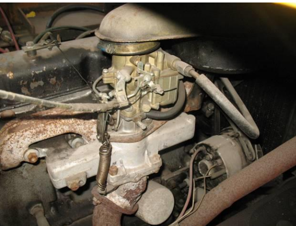
Iekrāvējs Toyota 52-6FG35