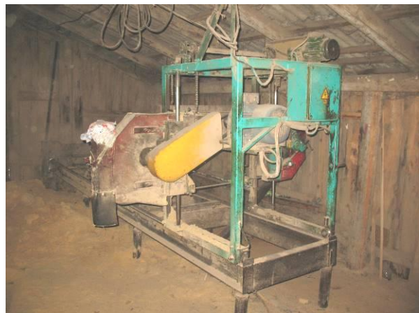
Horizontālais lentzāģis AUCE