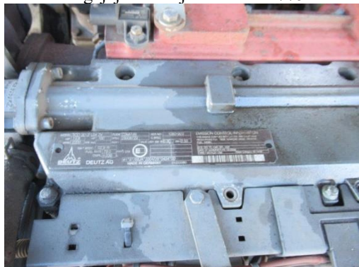
Pašgājēj iekrāvējs PAUS SL 775