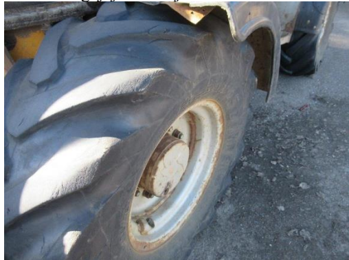
Pašgājēj iekrāvējs PAUS SL 775