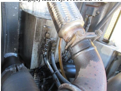
Pašgājēj iekrāvējs PAUS SL 775