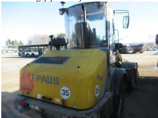
Pašgājēj iekrāvējs PAUS SL 775