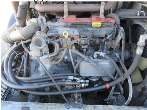
Pašgājēj iekrāvējs PAUS SL 775