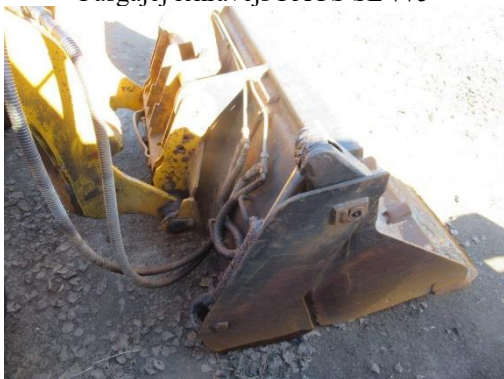
Pašgājēj iekrāvējs PAUS SL 775