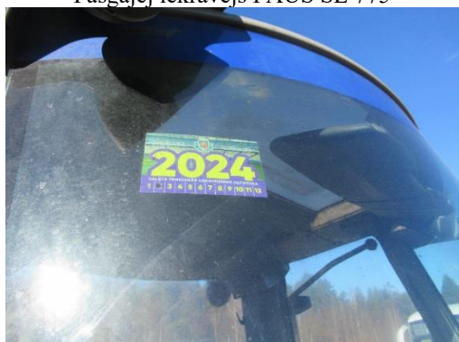
Pašgājēj iekrāvējs PAUS SL 775