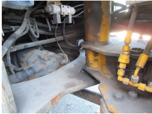
Pašgājēj iekrāvējs PAUS SL 775