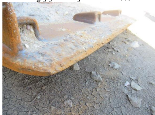
Pašgājēj iekrāvējs PAUS SL 775