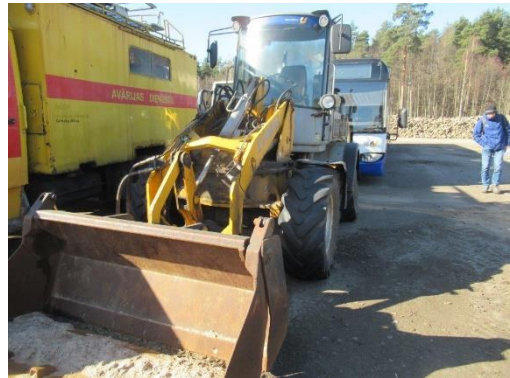
Pašgājēj iekrāvējs PAUS SL 775