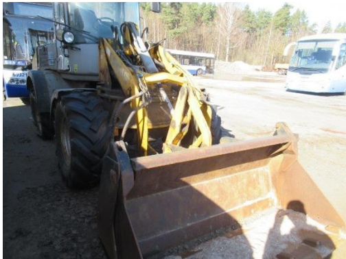
Pašgājēj iekrāvējs PAUS SL 775