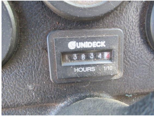
Pašgājēj iekrāvējs PAUS SL 775