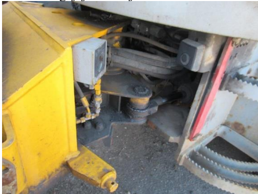
Pašgājēj iekrāvējs PAUS SL 775