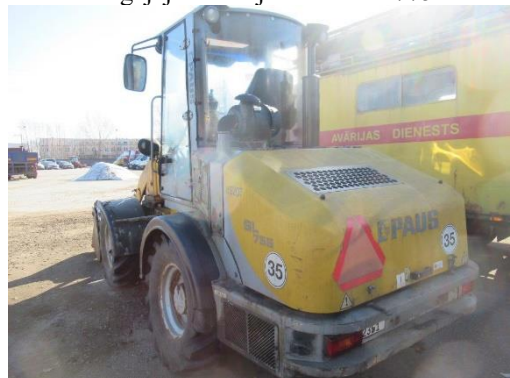
Pašgājēj iekrāvējs PAUS SL 775