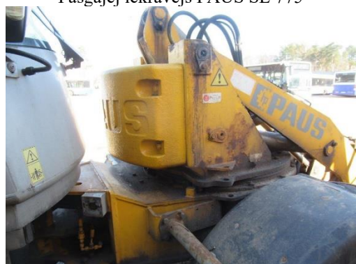
Pašgājēj iekrāvējs PAUS SL 775