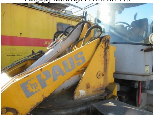
Pašgājēj iekrāvējs PAUS SL 775