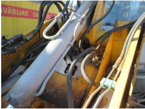
Pašgājēj iekrāvējs PAUS SL 775