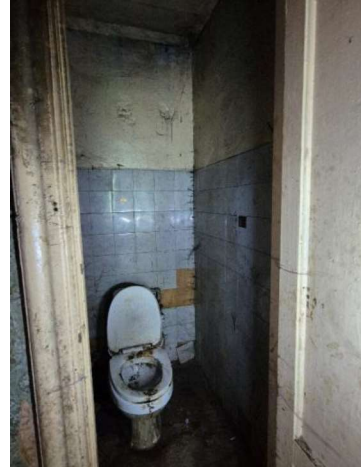
Tualete (telpa Nr.10)