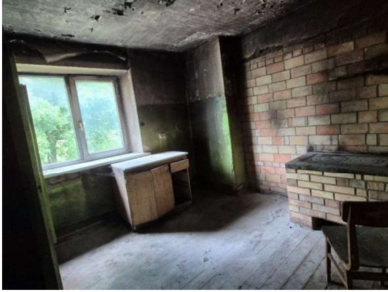
Virtuve (telpa Nr.5)