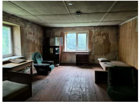
Istaba (telpa Nr.6)