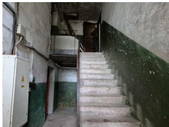
Skats uz ēku, kurā atrodas vērtējamais dzīvoklis