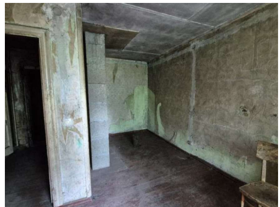
Istaba (telpa Nr.2)