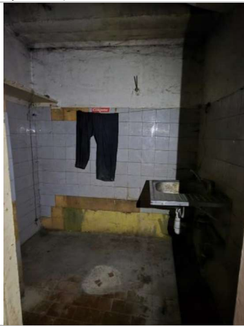
Telpa (telpa Nr.9)