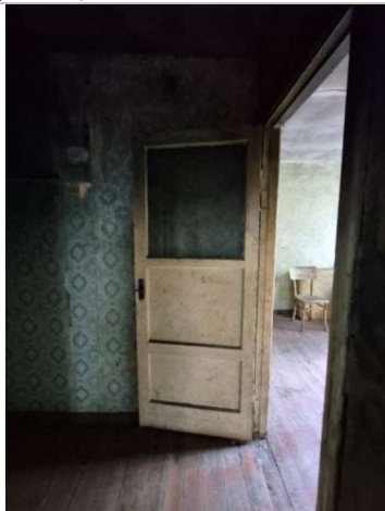
Gaitenis (telpa Nr.1)