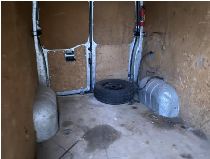
Attēls Nr. 9