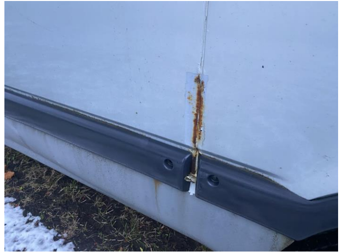
Attēls Nr. 8