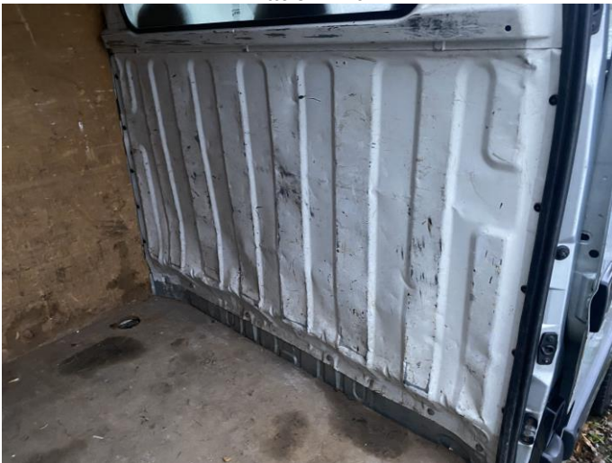
Attēls Nr. 17