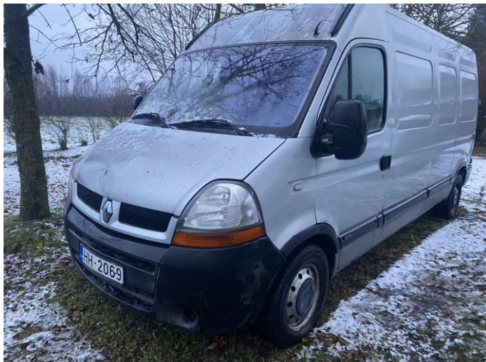
Attēls Nr. 1