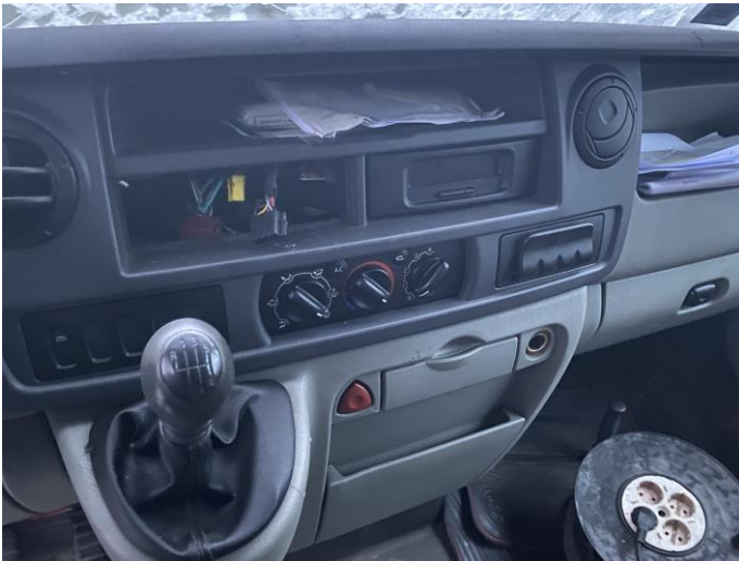
Attēls Nr. 15