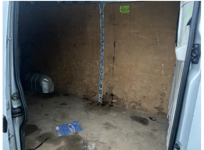
Attēls Nr. 10