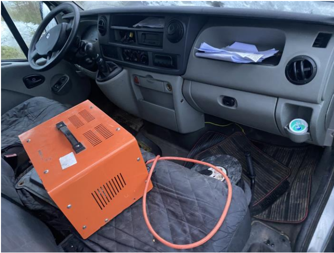
Attēls Nr. 13