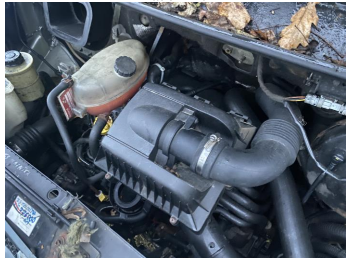
Attēls Nr. 18