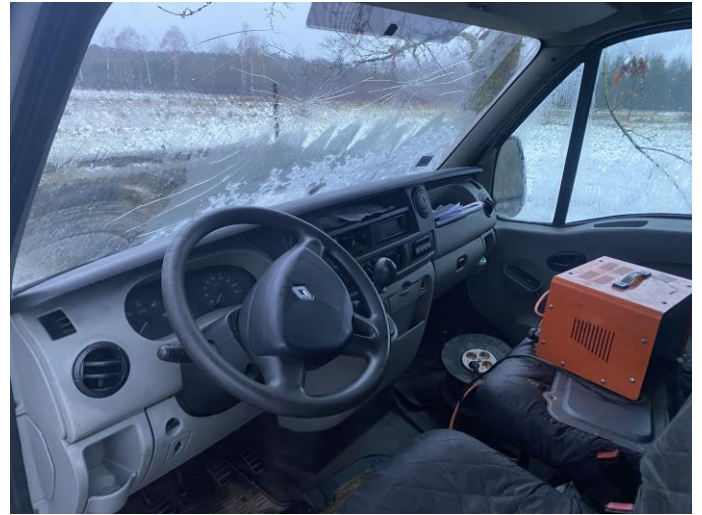
Attēls Nr. 14