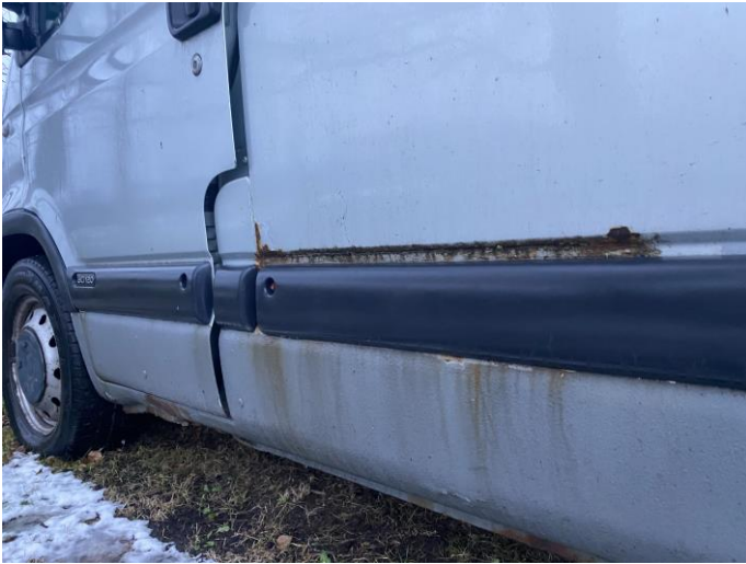
Attēls Nr. 7