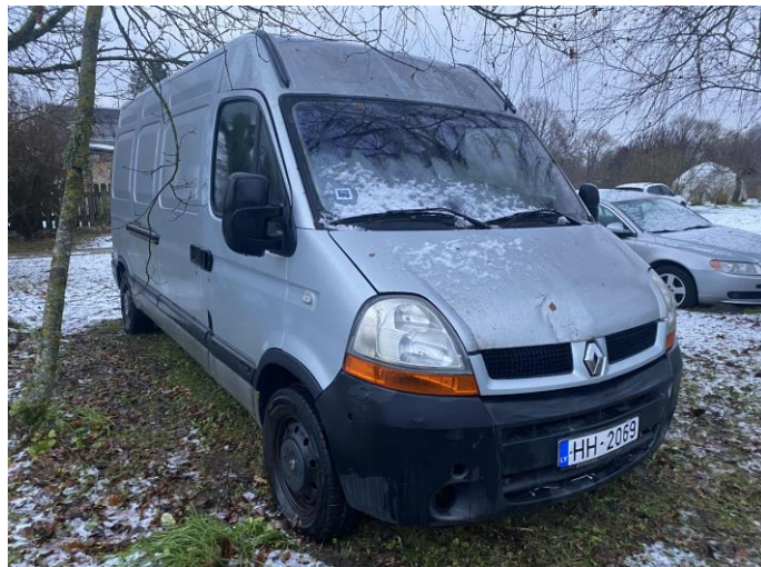
Attēls Nr. 2