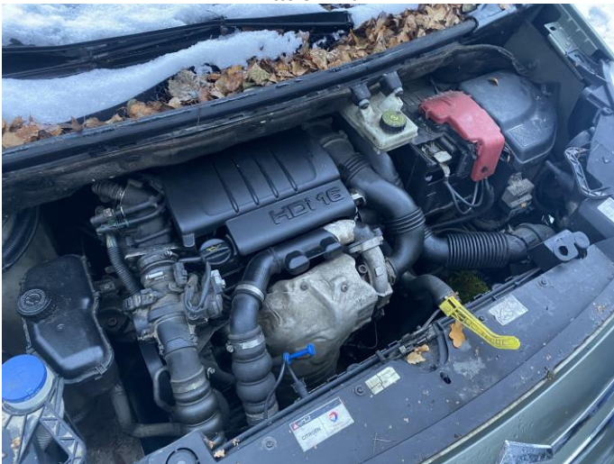
Attēls Nr. 11