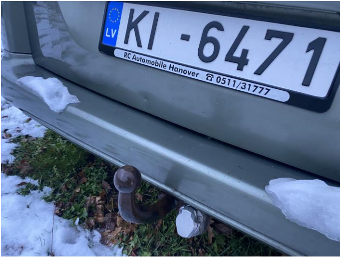
Attēls Nr. 7