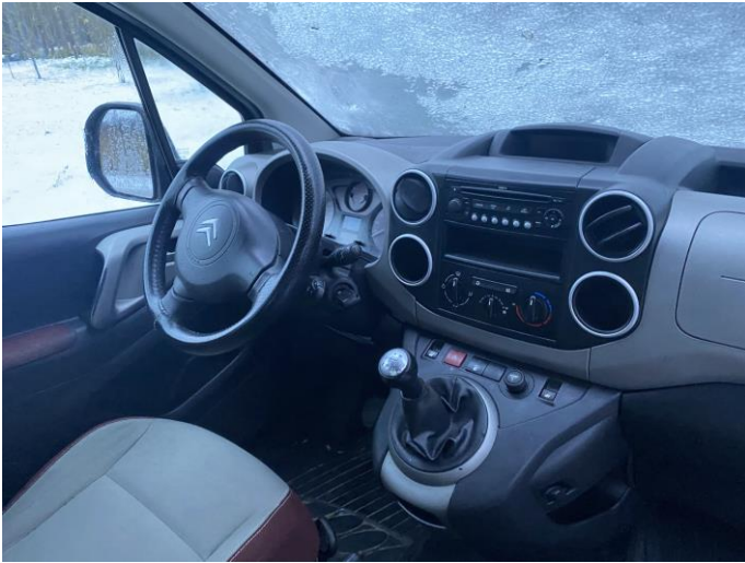
Attēls Nr. 13