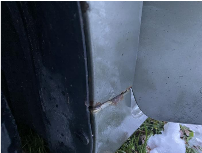
Attēls Nr. 9