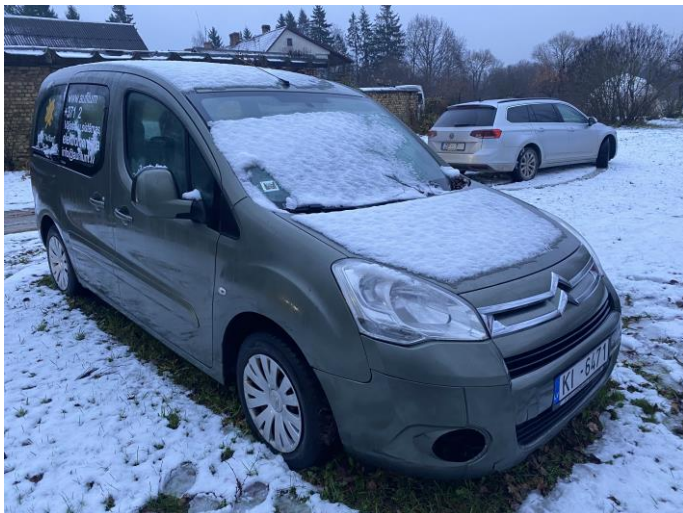
Attēls Nr. 1