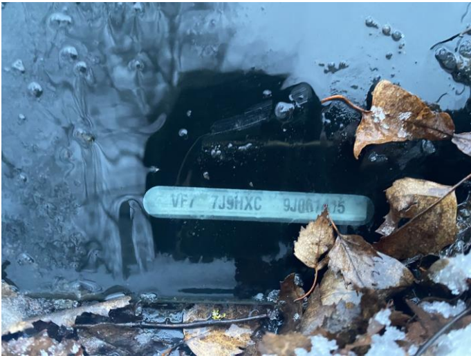
Attēls Nr. 15