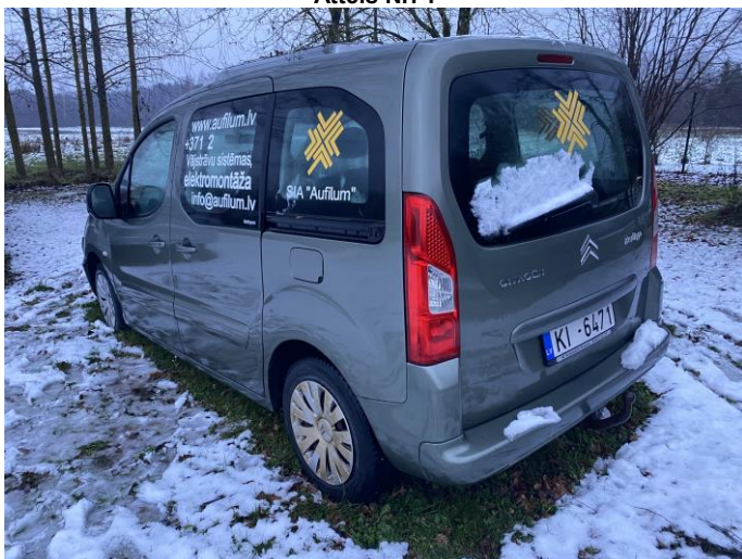
Attēls Nr. 3