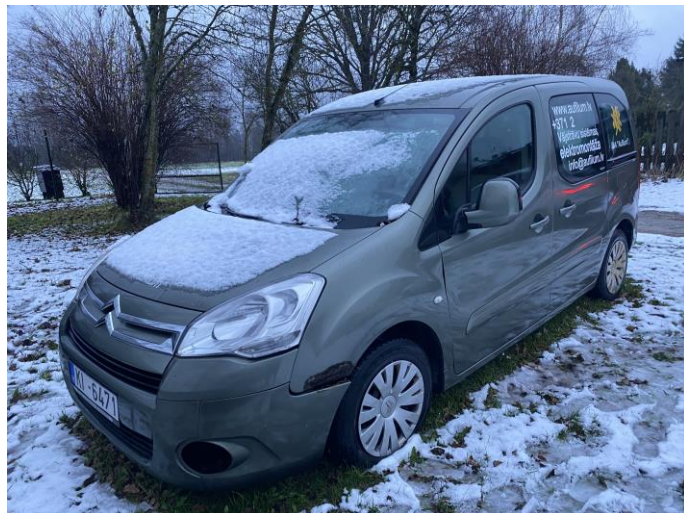
Attēls Nr. 2