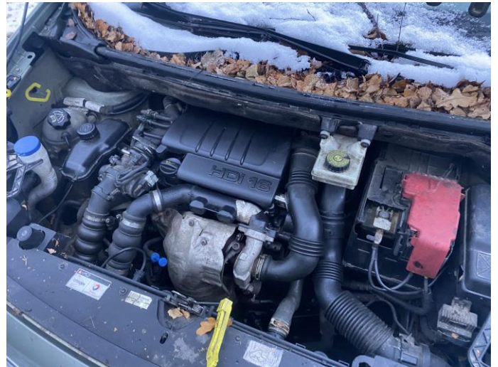
Attēls Nr. 10