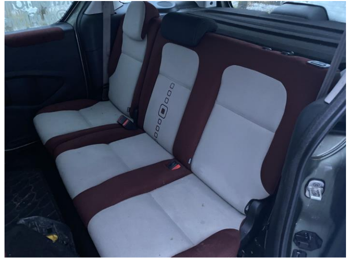
Attēls Nr. 14