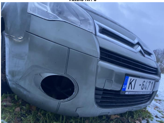
Attēls Nr. 5