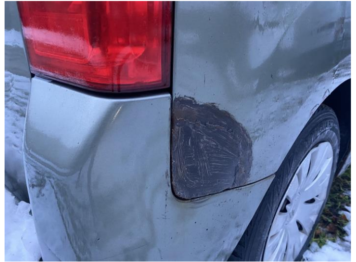
Attēls Nr. 8