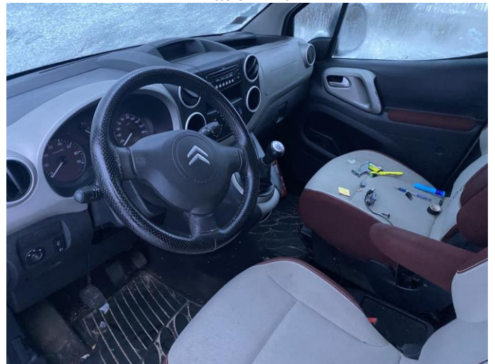
Attēls Nr. 12