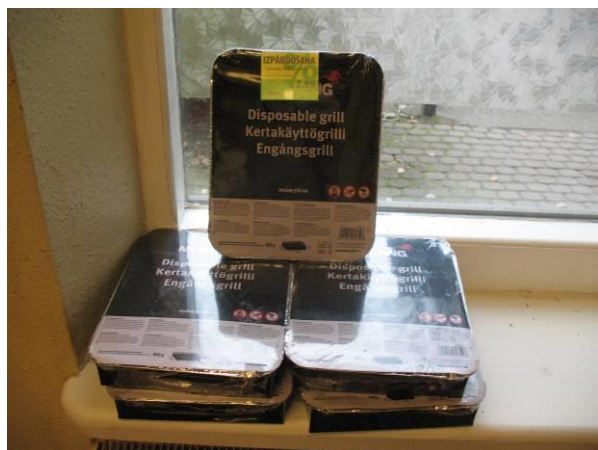
Krājumi – vienreizējās lietoānas grills