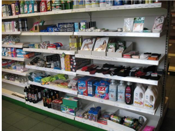
Krājumi – saimniecības preces