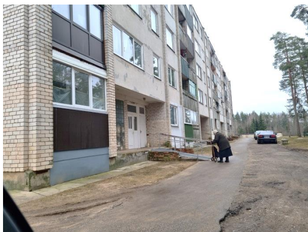
Daudzdzīvokļu mājas ārskati