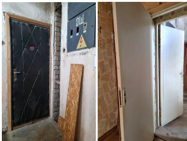
Dzīvokļa ieejas durvis