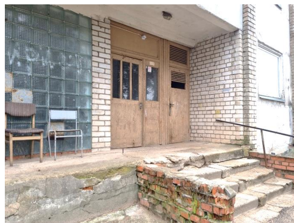
Daudzdzīvokļu mājas ārskati