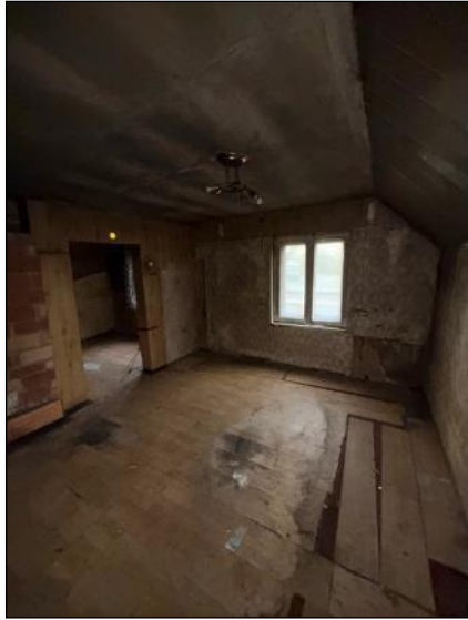
Istaba, telpa nr.1