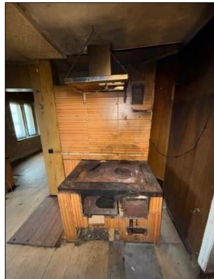
Virtuve, telpa nr.2