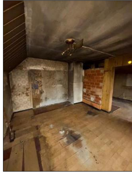
Istaba, telpa nr.1