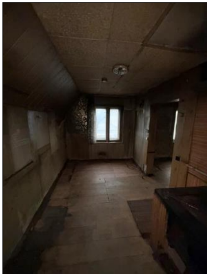
Virtuve, telpa nr.2