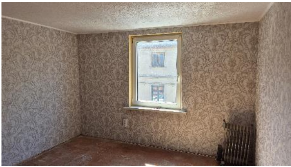
Istaba pret logu (telpa Nr.1)