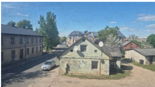
Skats pa logu no istabas (telpa Nr.2)