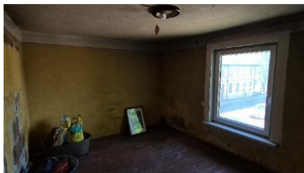
Istaba (telpa Nr.2)