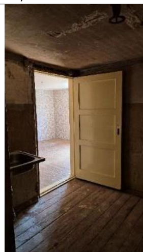
Virtuve (telpa Nr.3)