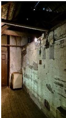
Skats uz dzīvokļa ārsienu no kāpņu telpas