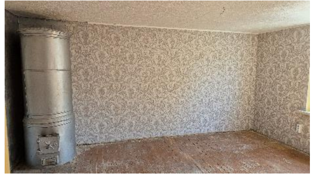
Istaba (telpa Nr.1)