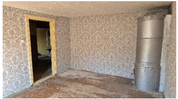
Istaba pret ieeju (telpa Nr.1)