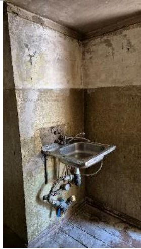
Virtuve (telpa Nr.3)