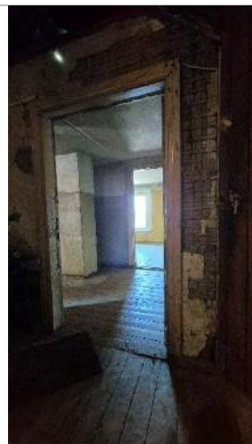
Skats dzīvoklī no kāpņu telpas