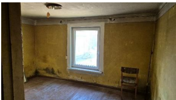
Istaba pret logu (telpa Nr.2)