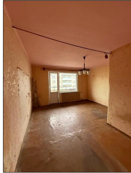
Istaba, telpa nr.1