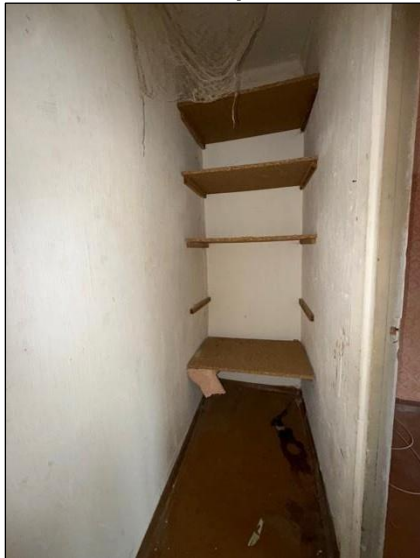
Pieliekamais, telpa nr.5