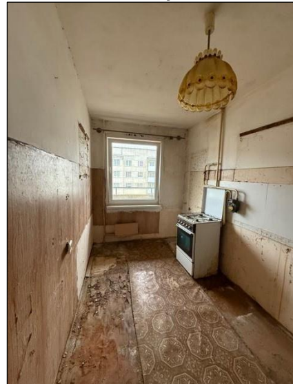
Virtuve, telpa nr.2