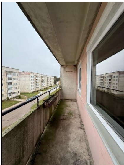
Lodžija, telpa nr.6