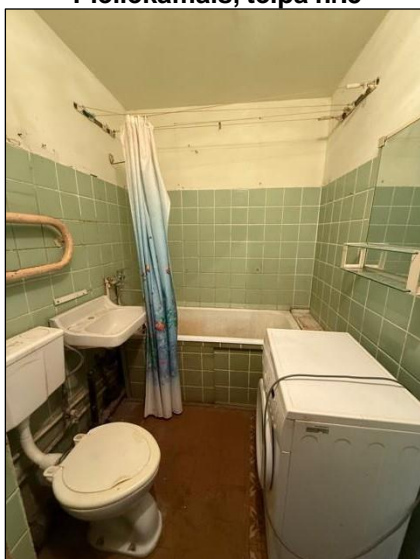
Sanitārais mezgls telpa nr.3