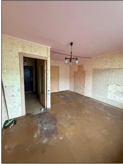
Istaba, telpa nr.1