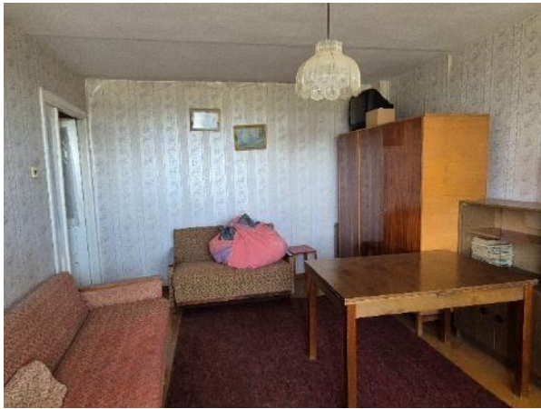
Istaba (telpa Nr.1)