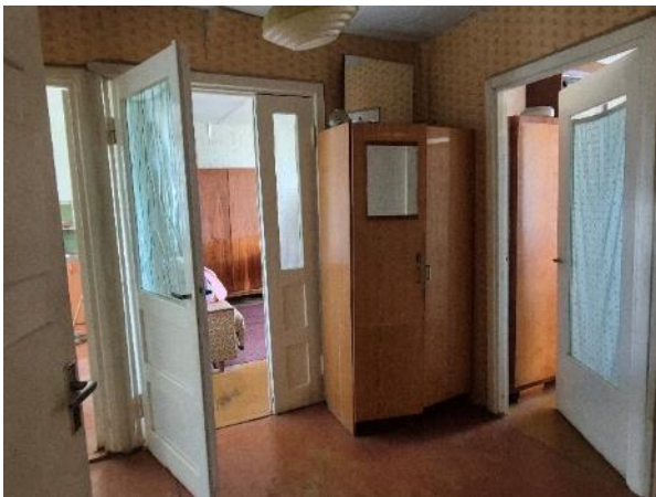
Skats dzīvoklī no gaitiņa