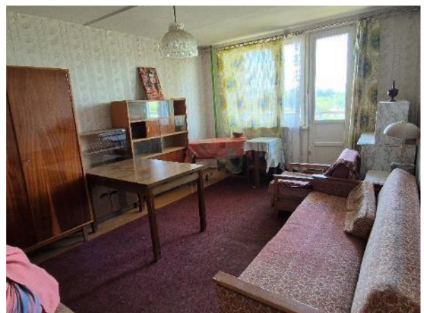
Istaba (telpa Nr.1)