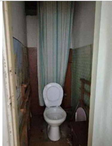
Istaba (telpa Nr.7)