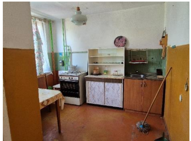
Virtuve (telpa Nr.4)