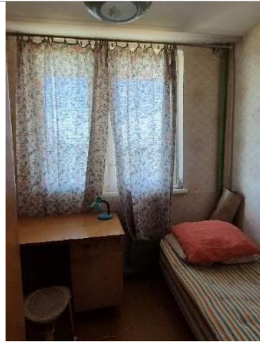
Istaba (telpa Nr.2)