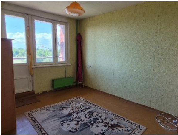
Istaba (telpa Nr.3)