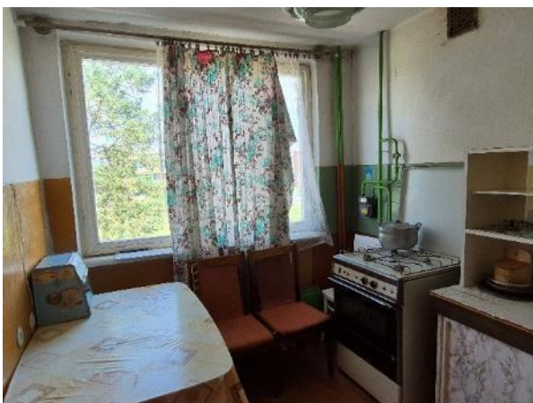
Virtuve (telpa Nr.4)