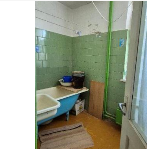
Vannas istaba (telpa Nr.6)