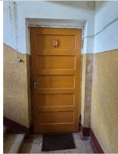
Skats uz dzīvokļa ārdurvīm