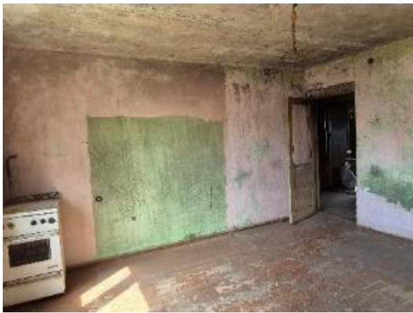
Istaba (telpa Nr.1)