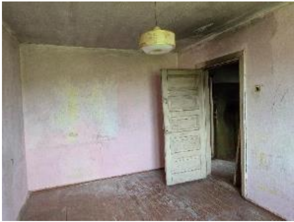
Istaba (telpa Nr.2)