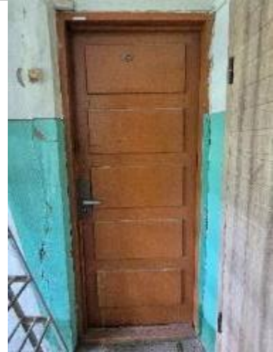
Skats uz dzīvokļa ārdurvīm