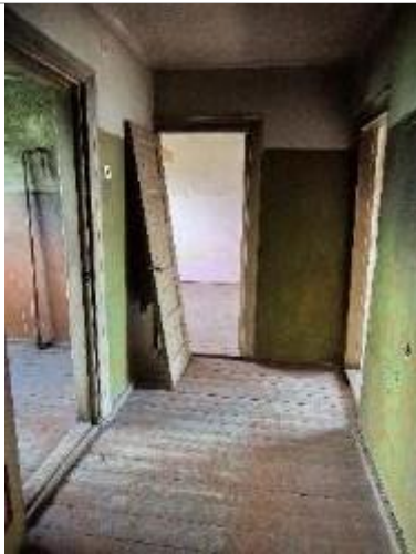
Skats dzīvoklī no gaitiņa