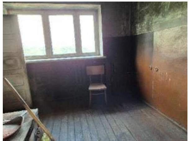
Virtuve (telpa Nr.3)