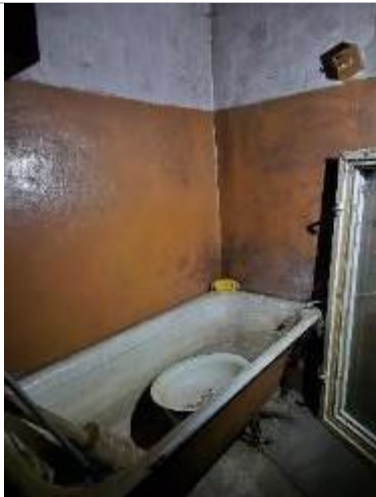
Vannas istaba (telpa Nr.5)