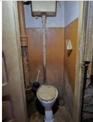
Istaba (telpa Nr.6)