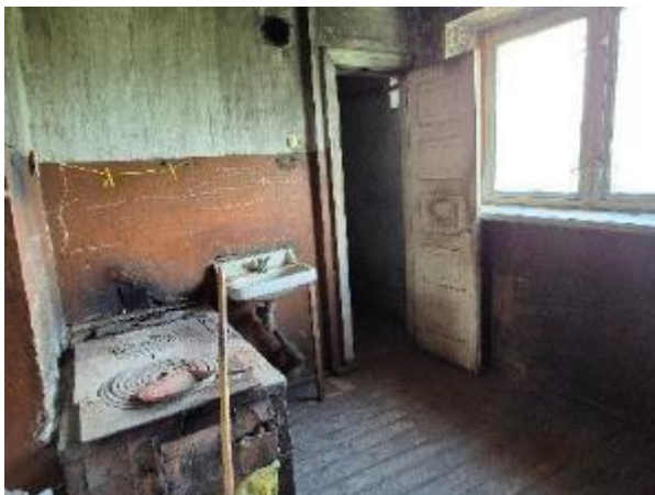
Virtuve (telpa Nr.3)