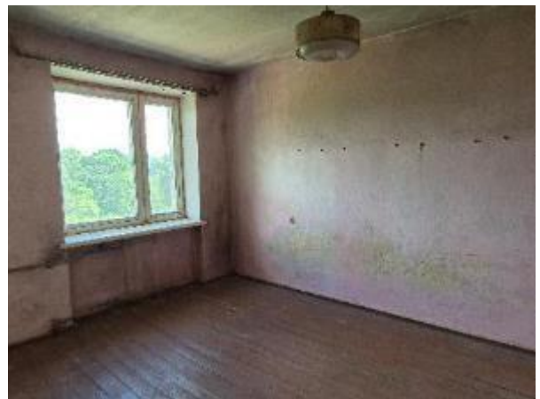
Istaba (telpa Nr.2)