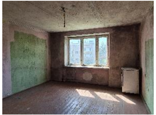
Istaba (telpa Nr.1)