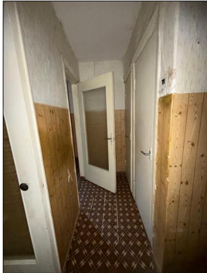
Gaitenis, telpa nr.7