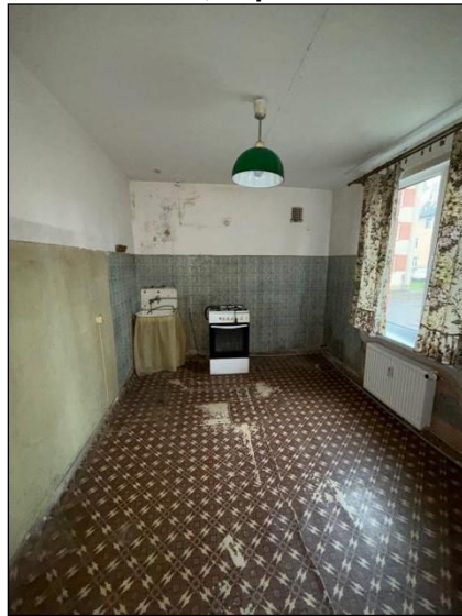
Virtuve, telpa nr.4