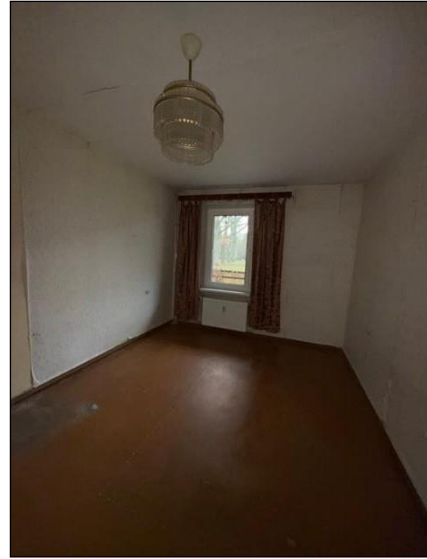
Istaba, telpa nr.2