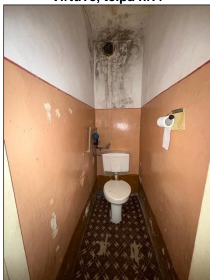
Tualete, telpa nr.7