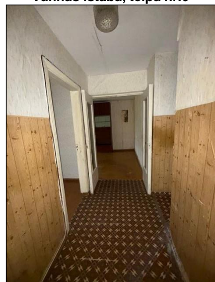
Gaitenis, telpa nr.7