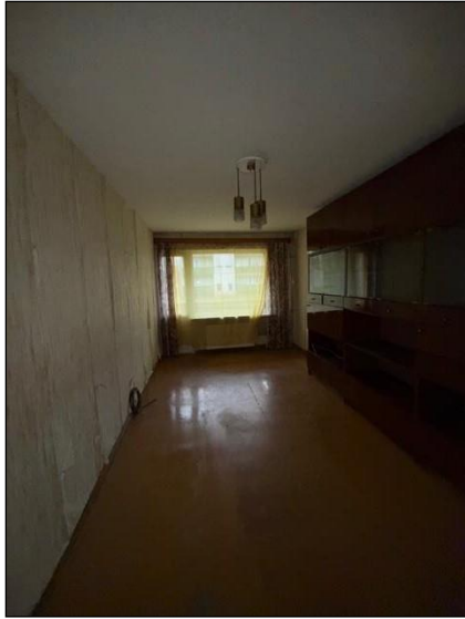
Istaba, telpa nr.3