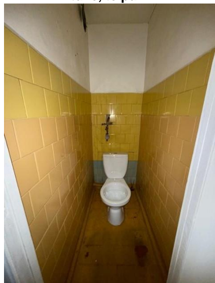
ualete, telpa nr.5