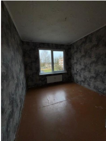
Istaba, telpa nr.6