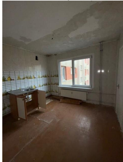
Virtuve, telpa nr.2