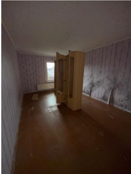
Istaba, telpa nr. 1