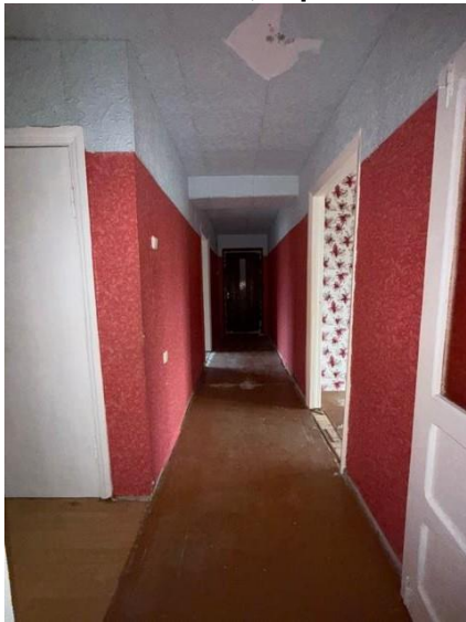
Gaitenis, telpa nr.7