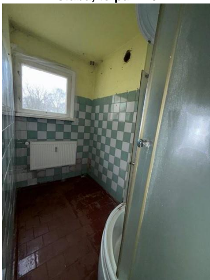
Vannas istaba, telpa nr.4