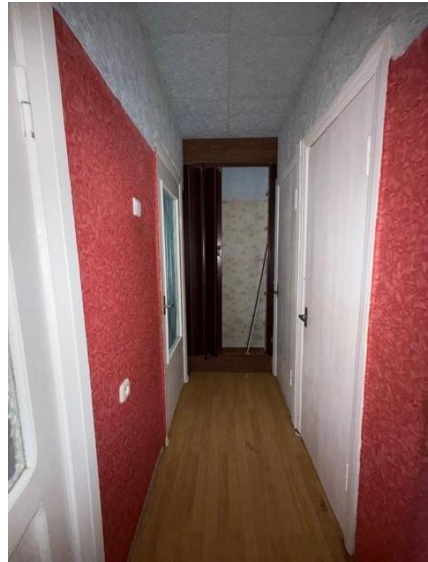
Gaitenis, telpa nr.7