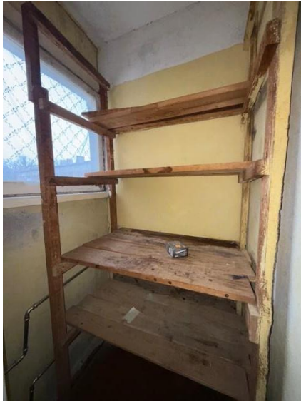
Pieliekamais, telpa nr.3