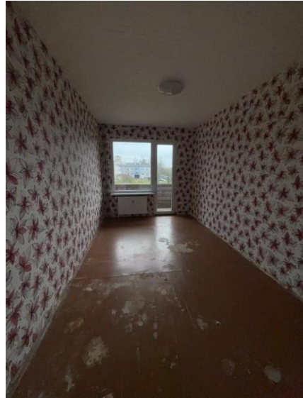
Istaba, telpa nr.8