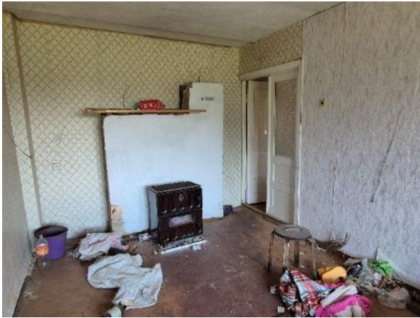
Istaba (telpa Nr.2)