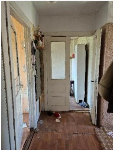
Skats dzīvoklī no gaitiņa