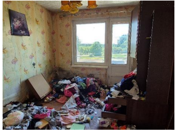
Istaba (telpa Nr.1)