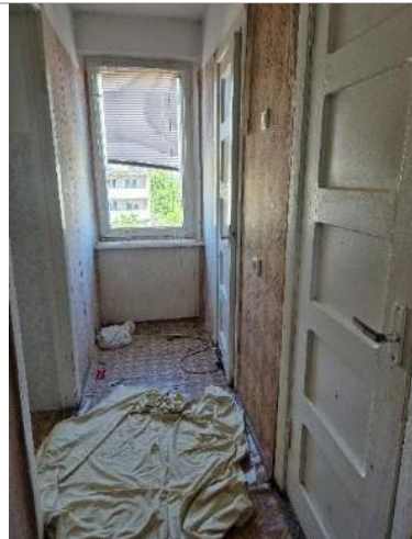
Gaitenis (telpa Nr.8)