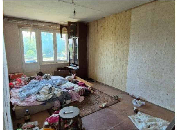
Istaba (telpa Nr.2)