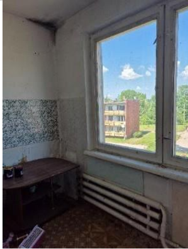
Virtuve (telpa Nr.3)