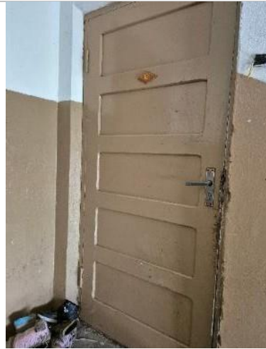
Skats uz dzīvokļa ārdurvīm