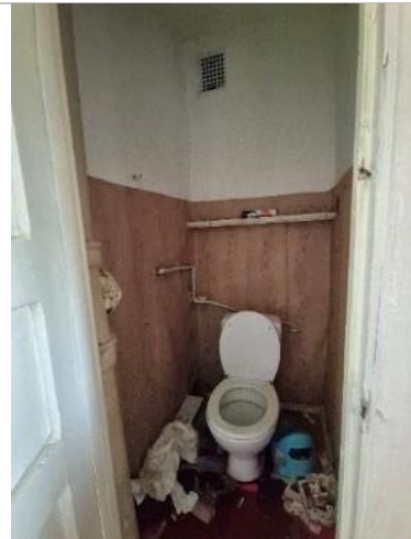
Istaba (telpa Nr.7)