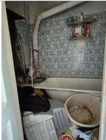
Vannas istaba (telpa Nr.6)