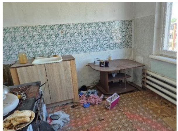
Virtuve (telpa Nr.3)